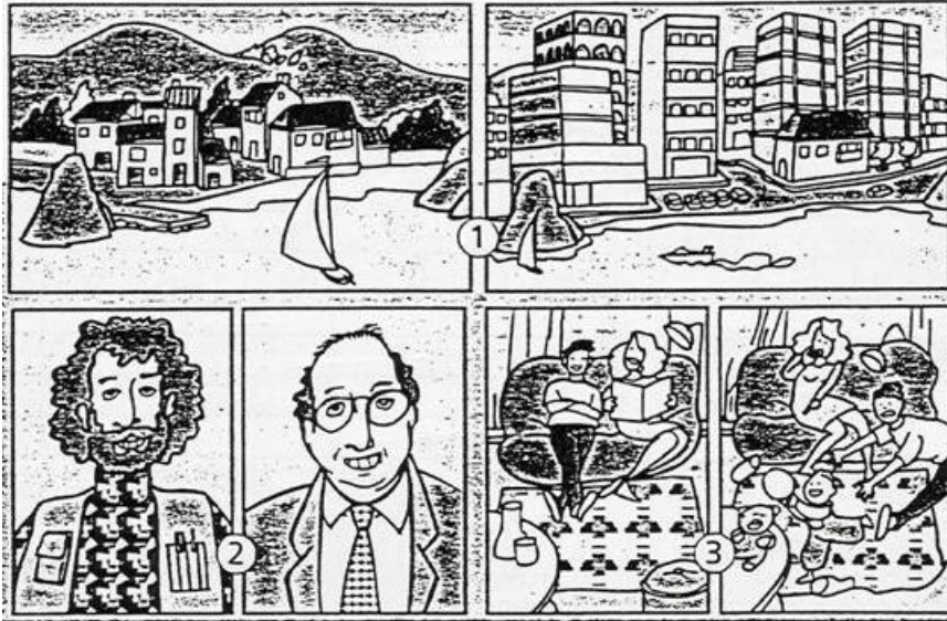
(Extraído de: MIQUEL & SANS. Rápido . Barcelona: Difusión.)

En la serie de dibujos a continuación, puedes observar que el tiempo ha producido una serie de cambios. Coméntalos.