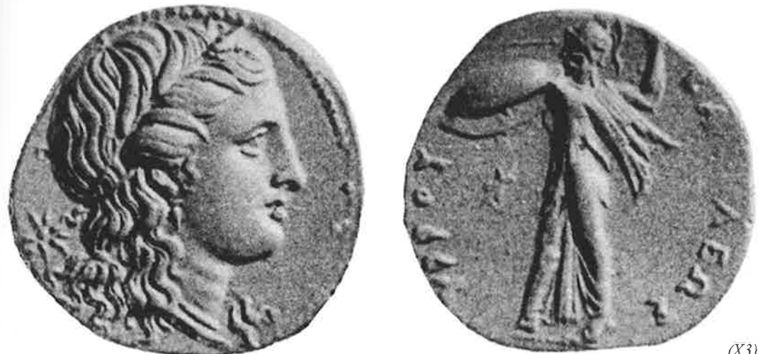
Fig. 17 – Representação de Perséfone em octóbolo de prata, cidade de Siracusa, s. III a.C.

A moeda potencialmente foi o primeiro dinheiro destinado a todos os propósitos, como diria Polanyi, em oposição aos dinheiros que serviam apenas a finalidades específicas. Com a moeda qualquer bem ou serviço poderia ser avaliado, independentemente de qualquer laço pessoal que viesse envolver os participantes de uma troca. Lembremos que antes da invenção da moeda existiram outros instrumentos de troca, dinheiros com finalidades específicas, que tinham sua ação limitada a certos tipos de bens e a certas esferas de relacionamento. Mas, esta potencialidade da moeda em servir a todos os tipos de troca, será apenas completada tempos depois de