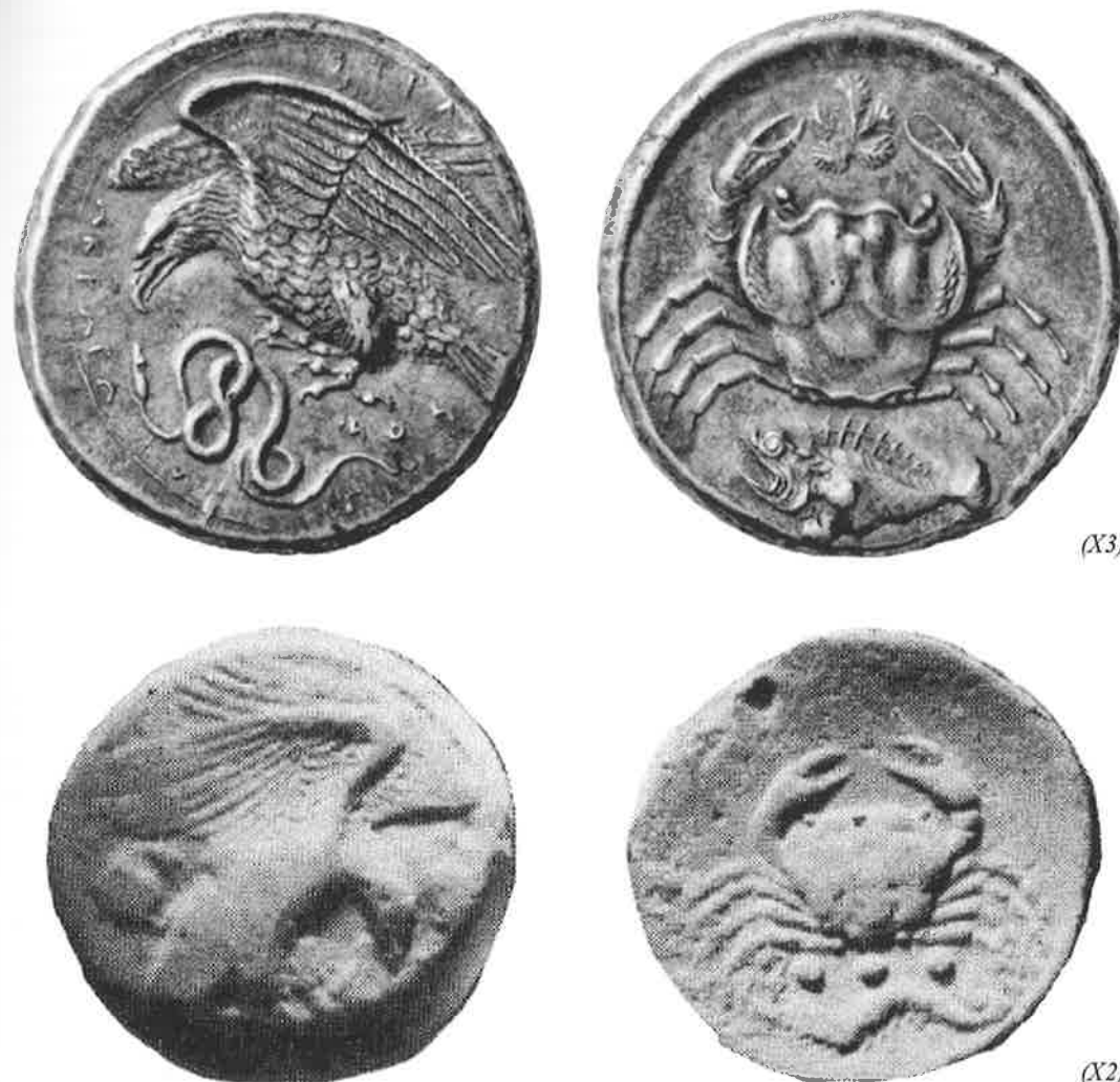
Fig. 6 – Moedas de prata e de bronze que circulavam juntas, cidade de Agrigento, Sicília, s. V a.C.

O segundo grupo de questões que apresentamos na tentativa de cercarmos o nosso objeto e