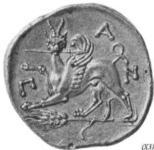
Fig. 15 – Estatêr de ouro da cidade de Panticapaeum com imagem de Grifo, s. IV a.C.

ajudando os gregos a combater os cartagineses de 276 a 274 (Fig. 17). A conclusão é de que não basta ser uma divindade muito cultuada para aparecer em moedas como preta a metodologia tradicional, é preciso ser a divindade adequada a este tipo de suporte – a moeda. Na Sicília, as ninfas ribeirinhas e das fontes e não Perséfone são as mais adequadas. Como vemos aqui nas representações da ninfa