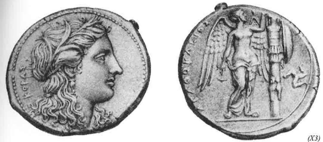
Fig. 16 – Representação de Perséfone em tetradracma de prata da cidade de Siracusa, s. IV a.C.

Gostaria de sugerir que a adoção da moeda pela sociedade grega ocorreu como expressão material de uma nova concepção de valor, universal e positiva, que tomava corpo no contexto da formação da pólis. A sua cunhagem foi sem dúvida uma invenção irresistível e foi adotada tão rapidamente por tantas póleis gregas porque se adequava perfeitamente ao processo mais amplo de codificação iniciado no século VII a.C. ou talvez até no VIII.