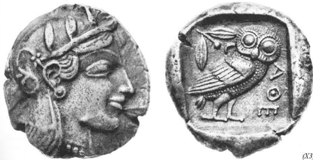
Fig. 7 – Representação da deusa Atena em moeda da cidade de Atenas, s. V a.C.

Entretanto, mesmo considerando estes pressupostos gerais, há uma variedade enorme de imagens que fogem de nossa compreensão e que a metodologia tradicional, presa ao destrinchamento das vicissitudes individuais de cada cidade, não tem dado conta de interpretar. Como entender esta imagem em que uma face humana é representada na