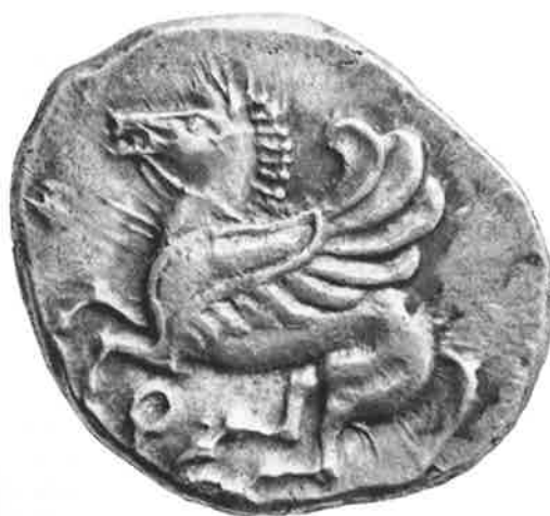
Fig. 5 - Primeira emissão de prata da cidade de Corinto, c.530-520 a.C.