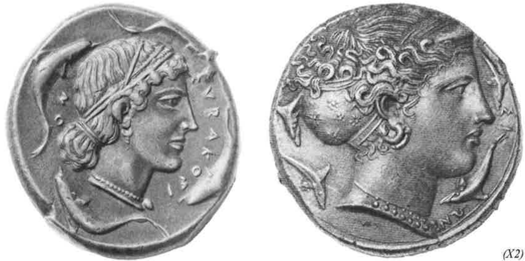
Fig. 18 – A ninfa Arethusa em tetradracmas de prata, cidade de Siracusa, s. V a.C.