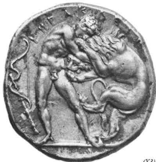
Fig. 10 – Dracma de prata da cidade de Agrigento, s. V a.C.