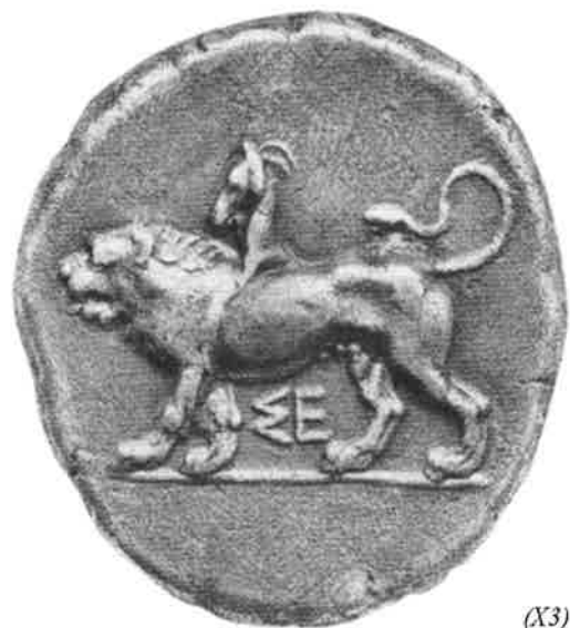
Fig. 14 – Estatêr de prata da cidade de Sicione com imagem de Quimera, s. V a.C.