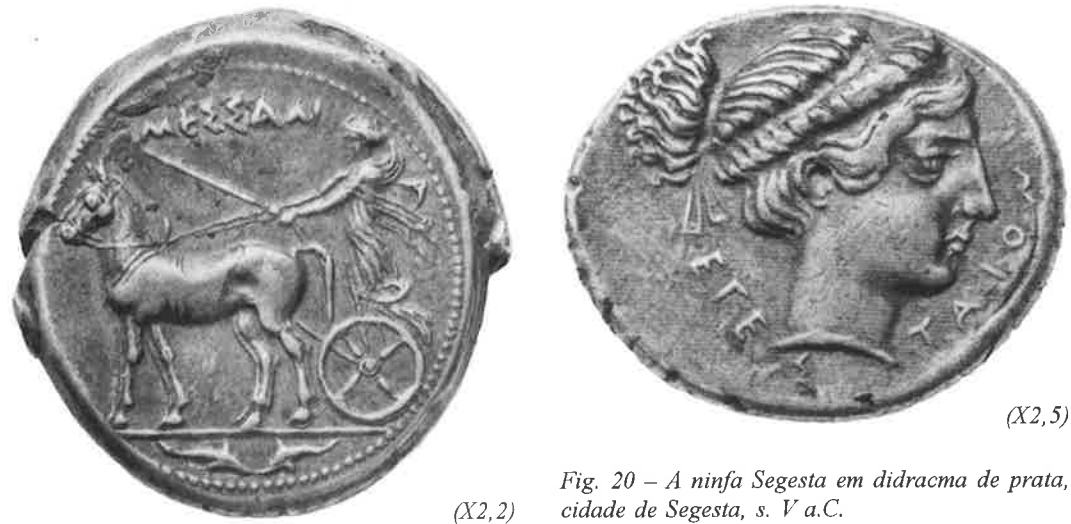
Fig. 19 – A ninfa Messana conduzindo sua biga de mulas em tetradracma de prata, cidade de Messana, s. V a.C.

da moeda não era totalmente aceita. O uso de templos como bancos, a magia de certas imagens monetárias, a neutralização religiosa de moedas falsas (afinal as moedas falsas poderiam ser refundidas e o metal reaproveitado), a confirmação de identidades políticas por meio das imagens monetárias, todos estes exemplos – enfim – falam a favor de uma moeda ainda impregnada por valores