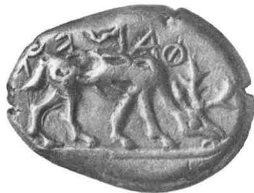
Fig. 1 - Estatér de eletro, Ásia Menor, s. VII a.C. Emissão atribuída a 'Fanes'.

Dentre os textos antigos que se referem à invenção da moeda, o mais respeitado e coerente é o de Heródoto. Escrevendo em meados do século V a.C., Heródoto explica no livro I, 94, 1 que: “Os lídios foram os primeiros entre os homens, até onde vai o nosso conhecimento, a cunhar e a usar moedas de ouro e prata, e também foram os primeiros a vender mercadorias a varejo”. Com efeito, provém da Ásia Menor, mais precisamente do templo da deusa Ártemis em Éfeso o achado das mais antigas moedas que conhecemos. Estas são moedas fabricadas de eletro – liga natural de ouro e prata – que possuem imagens emblemáticas e inscrições diversas, levando os especialistas a acreditar em várias autoridades emissoras, particulares, como no caso da moeda que traz a inscrição “eu sou o emblema de Fanes”, fanes sema eimi (Fig. 1), ou cívicas, como no caso das peças que trazem uma foca, símbolo da cidade de Focéia no norte da Ásia Menor (Fig. 2).