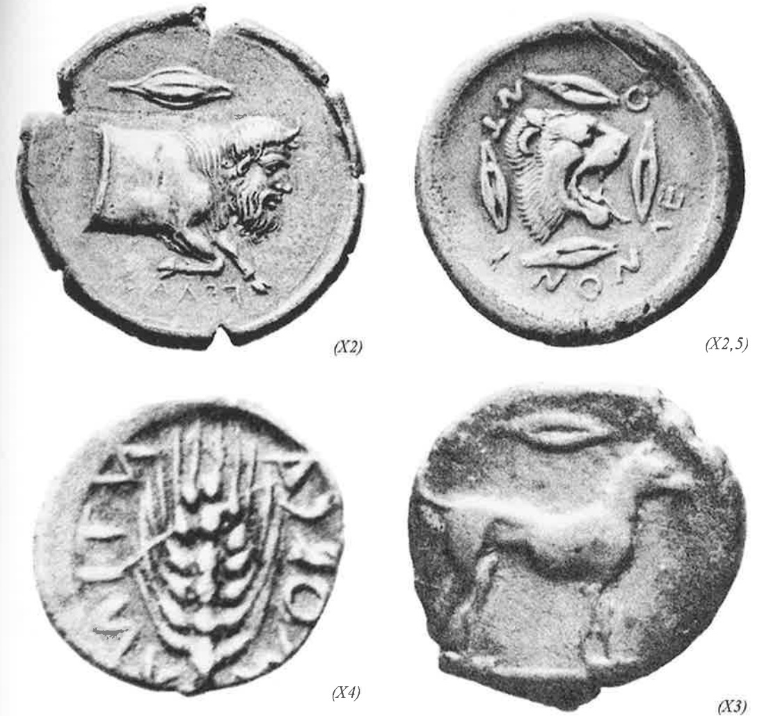
Fig. 21 – As representações de grãos e espigas de trigo em moedas de cidades da Sicília, s. V a.C.

não racionais vinculados a uma sociedade tradicional em que o relacionamento pessoal dava o tom. Acredito até que o potencial da moeda em despersonalizar as relações, potencial insuspeitado no início, será realizado muito tempo depois da sua introdução e de forma heterogênea pelo Mediterrâneo. Talvez em Atenas as coisas já estivessem bastante avançadas como não apenas Aristóteles registra, mas como dão a entender os textos de Demóstenes, Lísias e outros oradores do século IV a.C. os quais não teríamos tempo de repassar aqui. Em outras localidades menores e