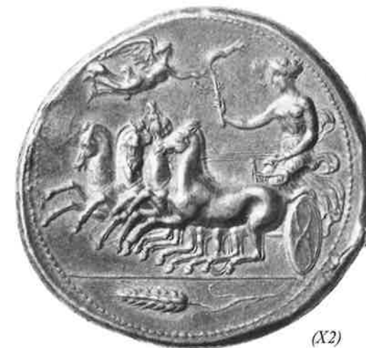
Fig. 22 – Representação de espiga de trigo em tetradracma de prata, cidade de Siracusa, s. V a.C.