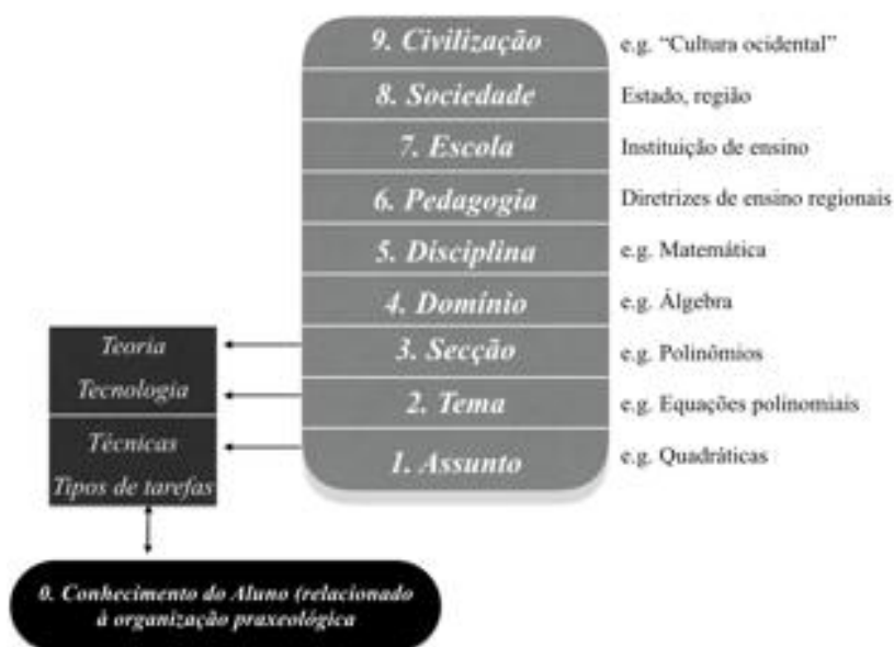
Fig. 2 - Níveis de co-determinação. Traduzido de Artigue e Winslow (2010)

Para Artigue e Winslow (2010) as praxeologias, tanto didáticas quanto relativas às áreas de conhecimento, não podem ser entendidas sem se considerar os contextos em que estão inseridas. São determinadas pelas hierarquias dos diversos níveis institucionais que acabam por promover possibilidades e restrições às mesmas. Os níveis de determinação didáticas são, assim, definidos a partir dos conteúdos/matérias trabalhados na sala de aula, passando pelos temas, setores, domínios, disciplinas, pedagogias, escola, sociedade e civilização, aos quais os conteúdos pertencem. A seguir, apresentamos um exemplo de Artigue e Winslow (2010:6) sobre os níveis de determinação didática relativa a conteúdos da matemática. Nota-se que os locais onde as teorias e tecnologias (logos) e as técnicas e tarefas (práxis) serão definidas são aqueles mais diretamente ligados ao processo de ensino pelo professor e de aprendizagem pelo aluno.