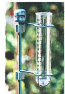
Pluviômetro coletando chuva.

Reprodução proibida. Art. 184 do Código Penal e Lei 9.610 de 19 de fevereiro de 1998