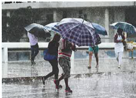
Chuva no município de Brasília, no Distrito Federal, em 2014.