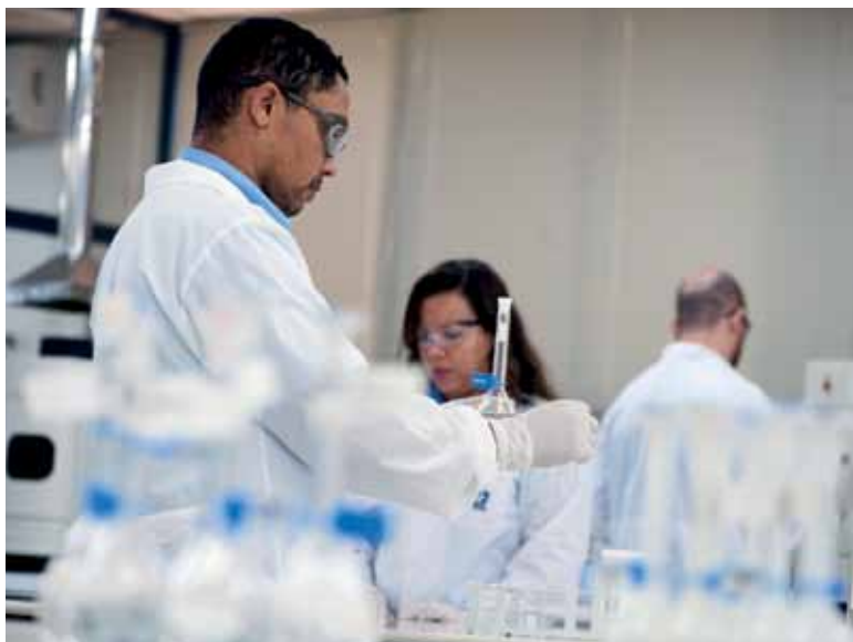
Técnicos do laboratório de controle de qualidade do Centro de Tecnologia da CBMM

sa. Ao mesmo tempo, apoia grupos no exterior com competência em temas de interesse relacionados ao nióbio”, informa Landgraf, da Poli-USP.