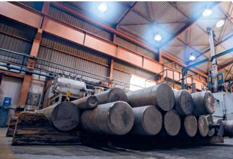
Lingotes de nióbio metálico da Escola de Engenharia de Lorena da USP

que a convencional. Na indústria automotiva, as carrocerias dos carros ficam mais leves sem perder a resistência. A redução do peso melhora a eficiência de veículos à combustão e elétricos”, conta Stuart. Em oleodutos e gasodutos, aplicação mais tradicional, o nióbio impede a propagação de trincas e, ao mesmo tempo, permite a construção de estruturas mais delgadas. “A espessura das paredes pode ser reduzida para 20 milímetros (mm), metade da medida de tubulações fabricadas sem ferronióbio”, explica.