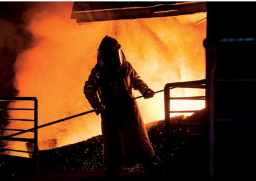
Etapa de metalurgia, fase final de produção do ferronióbio

dos produtos de nióbio, entre US$ 40 e US$ 50 o quilograma, reage de acordo com o mercado. Se o preço aumentar de forma irracional e especulativa, os clientes buscarão outras opções.” Para efeito de comparação, a tonelada de minério de ferro vale US$ 90 (ou US$ 0,09 o quilo) e 1 onça de ouro (31,1 gramas) é negociada por US$ 1,3 mil – 1 quilo do metal custa US$ 41,8 mil, cerca de mil vezes o valor do nióbio.