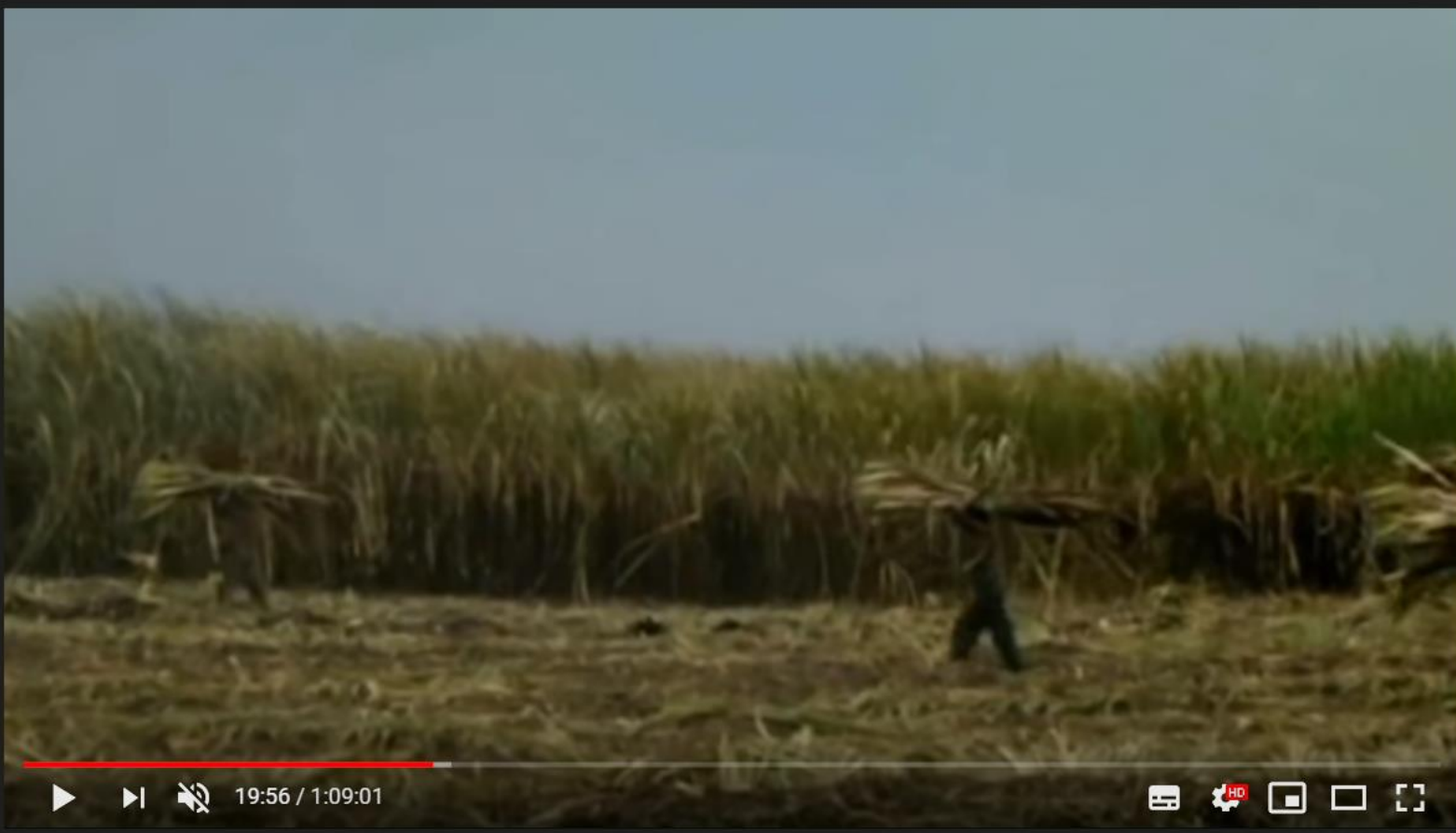
Britain's Forgotten Slave Owners S01 E02 The Price Of Freedom Official