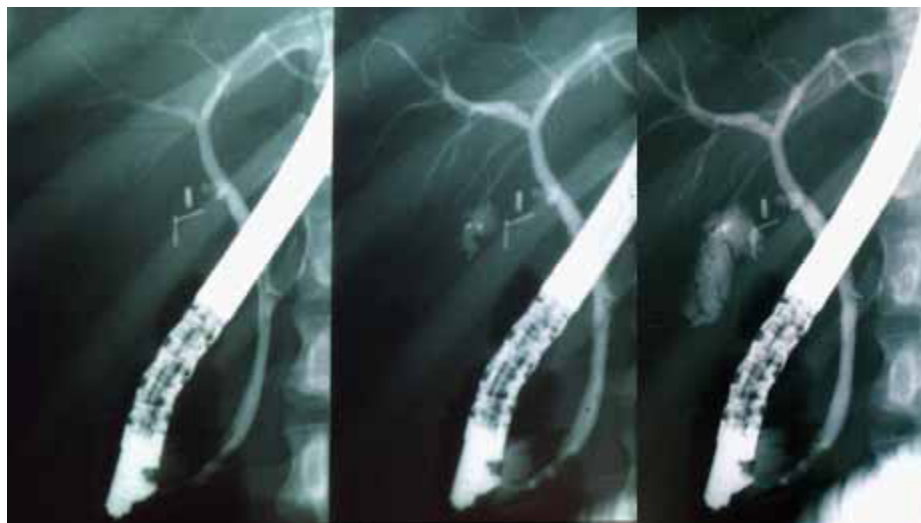
Figura 3: Colangiografia endoscópica retrógrada pós colecistectomia videolaparoscópica demonstrando extravasamento do contraste por meio de um pequeno ducto biliar que ficou aberto durante a cirurgia: Fístula biliar - coleperitônio após colecistectomia de vesícula escleroatrófica.

cirúrgico de várias afecções de média complexidade, a maioria passíveis de resolução em regime ambulatorial. Todavia, esta alternativa paliativa não foi convertida em política pública capaz de equacionar a listas de espera para tratamento cirúrgico de várias afecções de média complexidade.