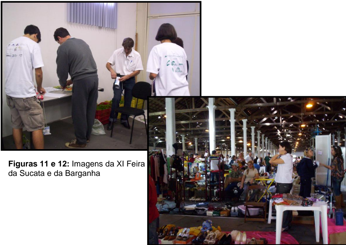
Figuras 11 e 12: Imagens da XI Feira da Sucata e da Barganha

Além das atividades de troca, compra e venda dos objetos, também foram promovidas atividades lúdicas e artísticas. Em 2009, além das apresentações teatrais e musicais, também foram oferecidas oficinas educativas, entre elas, horta suspensa (Figura 11).