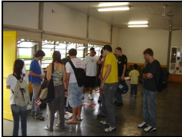
Figuras 3 e 4: II e III Feira da Sucata do Bixo