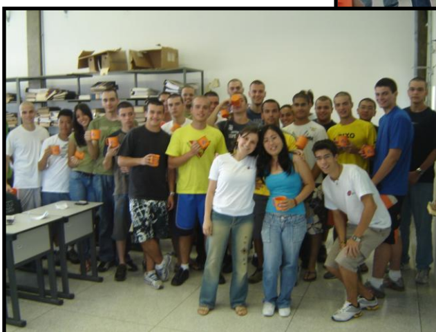
Figuras 1 e 2: Imagens calourada 2008 e 2009.