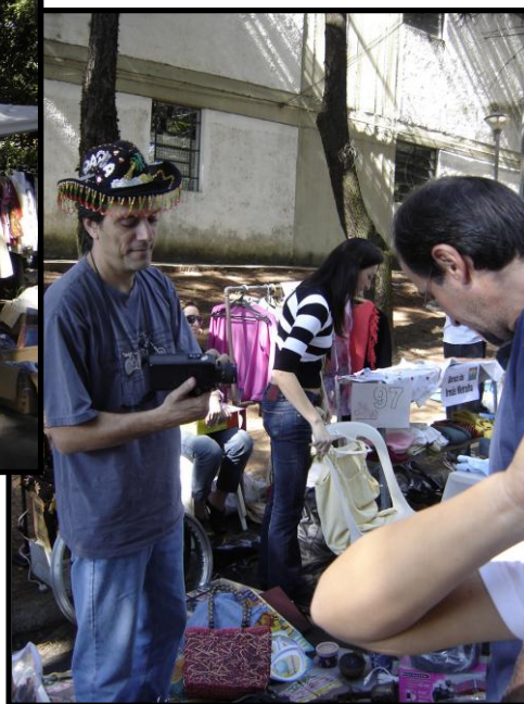
Figuras 9 e 10: X Feira da Sucata e da Barganha