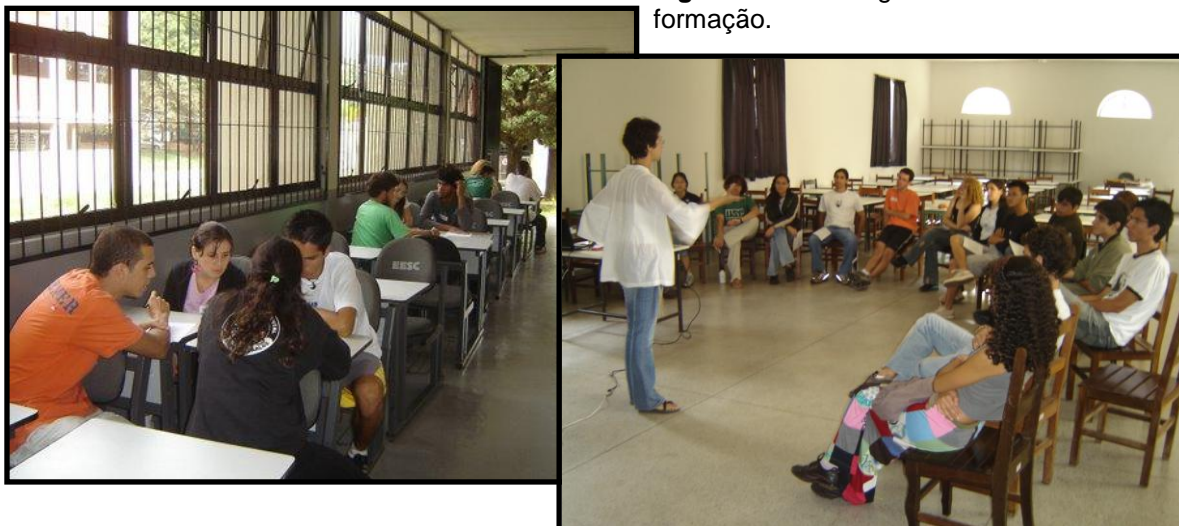
Figuras 7 e 8: Imagens das Oficinas de formação.

Foram realizadas 2 destas oficinas ao longo de 2008, a primeira em abril e a segunda em setembro, de forma a abranger todos os membros do USP Recicla do ano de 2008. Teve como objetivo contribuir para construção de conhecimentos sobre consumo, minimização de resíduos, compostagem e educação ambiental crítica; aprimorar conhecimentos a cerca do programa USP Recicla (funcionamento, estrutura e princípios), além de integrar os membros do Programa – estagiários, voluntários, educadora, etc. No primeiro encontro participaram um total de 20 pessoas e no segundo, 17.