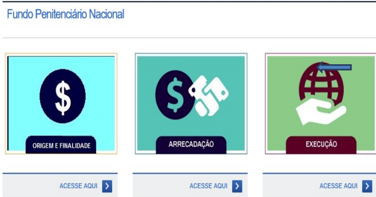
Figura 3: Banner na internet para acesso à execução do Funpen.

141. O caminho natural para os usuários e interessados em acompanhar o emprego dos recursos do Funpen seria acessar o banner ‘EXECUÇÃO’.