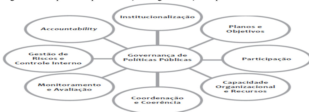
Figura 5: Componentes para avaliação da governança em polít

243. Nesta fiscalização, como registrado, utilizou-se como critério de análise da governança no sistema prisional o Referencial para Avaliação de Governança em Políticas Públicas do Tribunal de Contas da União, documento que estabelece um modelo para avaliação da governança em políticas públicas com oito componentes: