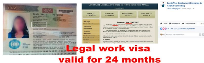
Anúncio feito por agência filipina no Facebook para trabalho com visto no Brasil

Ao chegar no Brasil, porém, as trabalhadoras descobriram que a promessa de residência era enganosa e a lei trabalhista não estava sendo aplicada. “A questão do engano é muito flagrante, é totalmente diferente como é vendida a vaga de empregos e o que elas encontram aqui,” diz a auditora.