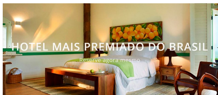
Filipinas que trabalhavam em hotel de luxo também não recebiam alimentação adequada

Ainda que não tenha sido constatado trabalho escravo, os auditores fiscais também encontraram uma série de irregularidades entre filipinas funcionárias do hotel e spa Lake Villas, que se intitula o “hotel de luxo em São Paulo mais premiado do Brasil”. A diária mais barata para um hóspede supera R$ 2.400 em sites de turismo.