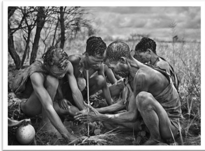
Crédito: Sebastião Salgado, 2010