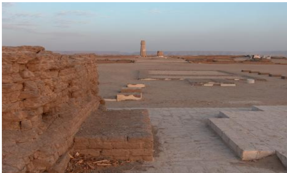
Restos de la ciudad de Akhenatón

construcción fue un proyecto masivo. Comenzada en el quinto año de Akenaton y abandonada poco después de su muerte en su año número diecisiete, debió requerir un esfuerzo colosal construir la ciudad en tan poco tiempo. Akhenatón no era una excepción en el Nuevo Imperio Egipcio: Ramsés II construyó su propia capital en Per-Ramsés, hoy poco conocida, pero elogiada en la antigüedad. En otros estados encontramos la misma práctica de construir nuevas capitales: Al-Untash-Napirisha en Elam, Dur-Kurigalzu en Babilonia y Kar-Tukulti-Ninurta en Asiria. Todos los nombres de estas ciudades incorporan el nombre específico de gobernante, excepto por Akhenatón que refiere más al dios personal del emperador que a él mismo. Estas no eran construcciones para el pueblo, sino ciudades enteramente construidas como residencias para el rey. Su capacidad para construir las, todas ellas de un tamaño sustantivo, si no gigantesco, demostraba la abundancia de recursos que estaban disponibles para él. Ellas mostraban un deseo de alejar al gobernante del pueblo, y reflejan la lucha de poderes que había entre las élites. Es como si en esos lugares fuera creada una completa nueva burocracia, una de homines novi quienes eran totalmente dependientes del rey, más que de sus vínculos familiares, para su estatus social.