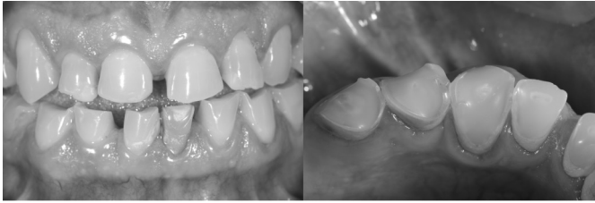
Figura 2. Vista frontal da cavidade bucal com expressiva perda estrutural de esmalte e dentina devido ao hábito de chupar limão por um período de 10 anos (A). Em detalhe, evidenciam-se exposição dentinária e, no dente 43, visualiza-se a câmara pulpar por transparência (B).