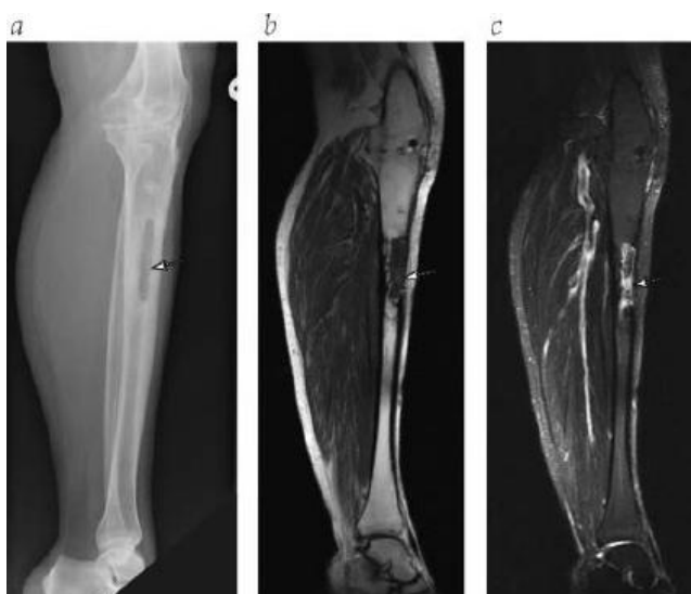
Figura 2. Imagem de ressonância magnética (IRM) mostrando um sequestro (seta). O sequestro não está visível na (a) radiografia simples, mas pode ser visto nas imagens (b) T 1 e (c) STIR (inversão-recuperação com tau curto).

Qual a conduta mais adequada para este paciente?