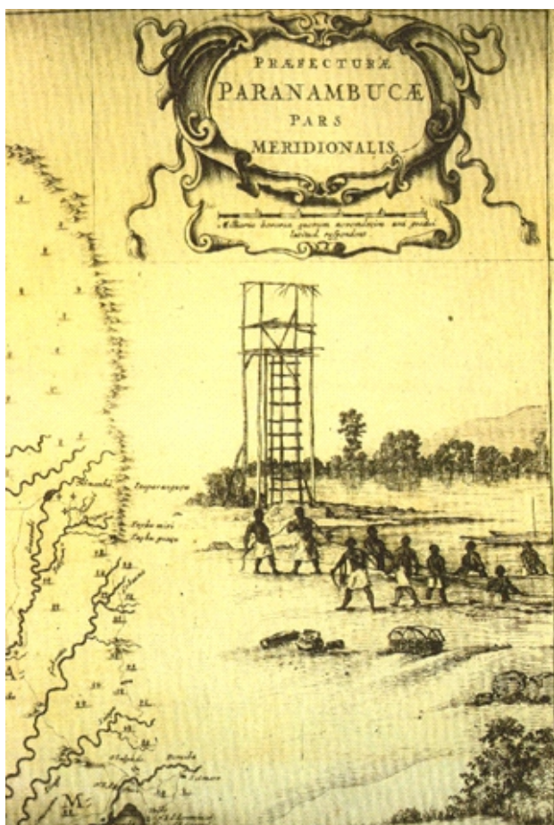
Figura 1. Quilombo de Palmares. In: Caspar Barleus, 1647, Rerum per Octennium in Brasilia

La república oligárquica establecida en 1889 no fue menos opresiva con estos grupos sociales y la primera gran rebelión contra el estado fue un movimiento mesiánico, sebastianista, en el Estado de Bahía, Canudos, conducido por un conocido mesías que era adepto de la monarquía, Antônio Conselheiro. El asentamiento reunía miles de personas y resistieron a los embates militares por algún tiempo, hasta ser destruido, con la mayoría de las