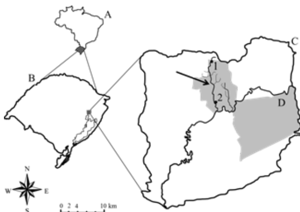
Figura 1 Localização dos sítios de coleta das amostras de água do arroio Luiz Rau (seta), no município de Novo Hamburgo (D), trecho inferior da Bacia do Rio dos Sinos (C), Rio Grande do Sul (B), Brasil (A). (1) Sítio no trecho inicial do arroio; (2) sítio no trecho final do arroio.

O arroio Luiz Rau está localizado em Novo Hamburgo, município que possui aproximadamente 250 mil habitantes, densidade populacional de cerca de 1.100 habitantes/km 2 e cuja economia está baseada principalmente na indústria coureiro-calçadista ( PMNH, 2015 ). O clima da área de estudo é do tipo Cfa segundo a classificação de Köppen, subtropical temperado, com temperatura superior a 22°C no verão e precipitação acumulada anual de cerca de 1.600 mm, distribuída uniformemente ao longo do ano ( PEEL et al., 2007 ). Os sítios de coleta de água do arroio foram denominados sítio 1, a 1,17 km da nascente (29°37'43,84"S; 51°08'09,65"W, 74 m de altitude) e sítio 2, a 2,15 km da foz (29°43'4,45"S; 51°07'55,02"W, 9 m de altitude) ( Figura 1 ). O sítio 1 localiza-se em um remanescente florestal inserido na matriz urbana de Novo Hamburgo, em cujo entorno há atividade de mineração superficial de rochas. O sítio 2 se situa a uma distância aproximada de 10 km do sítio 1, está localizado em um bairro residencial e comercial, e a vegetação é predominantemente herbácea, com presença de árvores isoladas.