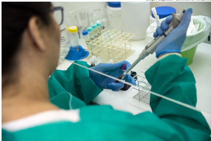
Pesquisador trabalha no Instituto de Ciências Biomédicas da USP, o mesmo do aluno que morreu

Diego Padgurschi - 26.fev.2016/Folhapress