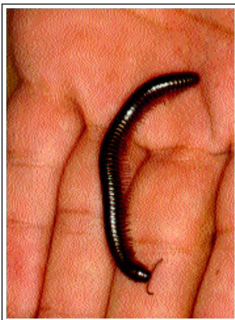
Figure 1: Rhinocricus padbergi (Diplopoda: Rhinocricidae): milpes, gongolo,

exulcerações, além de hiperpigmentação local. Os Millipedes não devem ser confundidos com as lacraias ou centopéias ( Chilopoda ), que têm forma semelhante, mas apenas um par de pernas em cada segmento corporal e são capazes de provocar acidentes por meio de ferrões cefálicos acoplados a glândulas de veneno.