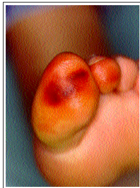
Figura 4: Caso nº 2 após 24 horas: hiperpigmen- tação e eritema / Figure 4: Case n. 2 after 24 hours: hyperpigmen- tation and erythema