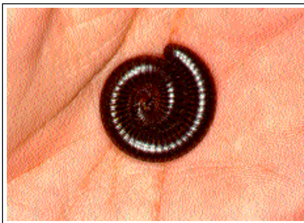
Figura 2: Rhinocricus padbergi (Diplopoda: Rhinocricidae): milpés, gongolo, piolho-de-cobra. Posição enrodilhada de defesa

Uma vez em contato com a pele humana, os líquidos e vapores expelidos podem provocar sensação de ardência, lembrando uma queimadura leve. 5 O local torna-se hipercrômico instantaneamente, com a cor variando entre amarelo-claro e marrom-escuro, por ação das quinonas. 2 Contatos prolongados com o animal (preso nas roupas, por exemplo) podem levar à lesões mais severas, com formação de vesículas, bolhas e exulcerações. O processo inflamatório está sempre presente, mesmo em lesões hipercrômicas discretas, e a hiperpigmentação pode persistir por meses. Os raros acidentes humanos