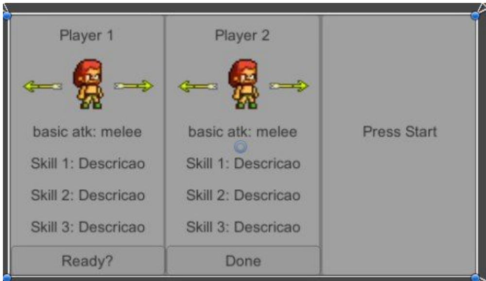
Seleção de personagem para jogar