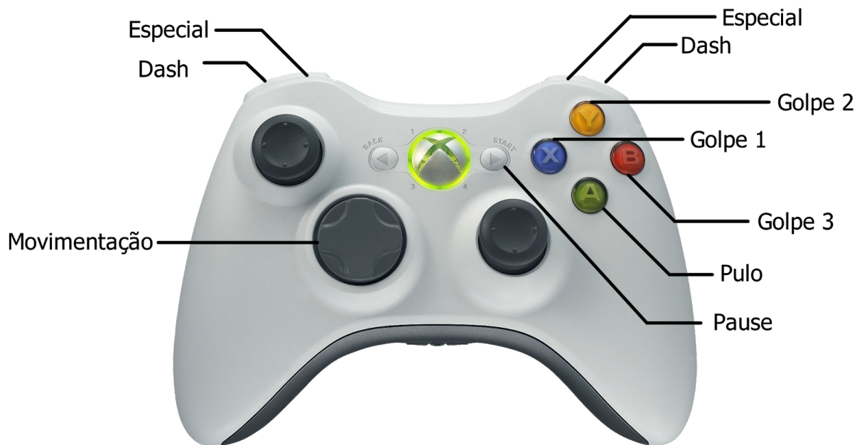
Imagem x - Controles para controle de Xbox