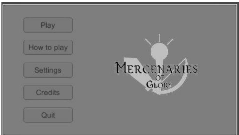
Menu inicial do Mercenaries of Glory

O objetivo do jogo é matar o boss e o jogador que causar mais dano a ele é o vencedor. O desafio é que cada jogador deve tentar cumprir esse objetivo ao mesmo tempo em que deve evitar que os outros jogadores façam o mesmo e por isso é possível que estes lutem entre si. Porém é preciso cautela! Afinal de contas o trabalho em equipe também é necessário para conseguir derrotar o boss.