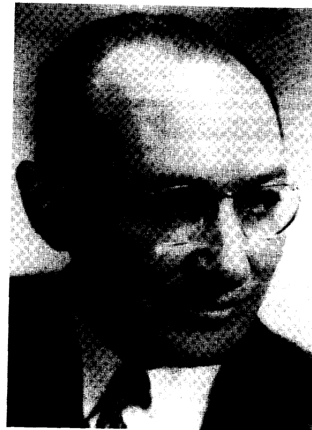
Figura 6.1: Kurt Lewin, fundador da psicologia social como uma ciência experimental e aplicada.

Outro personagem central no grupo da Gestalt foi Köhler, embora, desde uma perspectiva da história da psicologia social mais estrita, ele tenha sido uma figura menos importante que Lewin e Heider. Permaneceu em Berlim como diretor do Instituto de Psicologia, manifestando uma corajosa oposição ao regime nazista, até que sua posição tornou-se insustentável (Henle, 1986b). Aceitou um convite para as "William James lectures" em Harvard em 1934, e depois retornou para os Estados Unidos como professor no Swarthmore College (1935-1958). Em Swarthmore, exerceu influência sobre um colega seu, Asch, que viria a desempenhar um importante papel no desenvolvimento de uma forma cognitiva de psicologia social na era moderna. O livro de Köhler sobre a Gestalt Psychology (Köhler, 1947) é importante, no meu ponto de vista, porque aí ele elabora sua própria oposição ao behaviorismo que era a forma de psicologia dominante nos Estados Unidos. Foi somente quando migraram para os Estados Unidos que os psicólogos da Gestalt se defrontaram com o behaviorismo. Quando isto ocorreu, opuseram-se a ele. Era uma perspectiva radicalmente diferente das suas. Acredito que tenha sido no contexto do behaviorismo nos Estados Unidos que alguns deles (mais especialmente Lewin e Heider) se tornaram psicólogos sociais. Eles não eram psicólogos sociais em seus países de origem, na Alemanha e na Áustria.