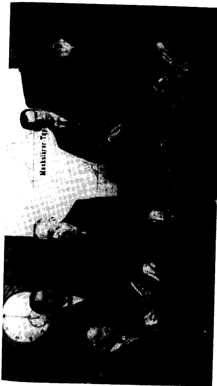
Figura 2.2: Guilherme Wundt e assistentes no Laboratório de Leipzig (cerca de 1910).

Um problema com uma ciência de laboratório que dependa, em grande parte, da introspecção, é a ausência de procedimentos sobre os quais se alcance um consenso para a solução de afirmativas conflitivas que provenham de laboratórios rivais. Um exemplo de tal conflito sem solução era se o pensamento ocorre em termos de imagens. Külpe, em Würzburg, defendia que o pensamento se dava sem imagens. Ele mostrou ser impossível resolver o problema através da introspecção. Foi esta característica da primeira ciência da mente que preparou o caminho, ao menos no Novo Mundo, para a emergência do behaviorismo. Aqui observador e observado eram duas pessoas diferentes ou, no caso de estudos com animais, um observador humano e um animal observado. Sendo que o objeto de observação era o comportamento, era possível obter medidas de confiabilidade inter-observadores. Isso era muito importante para preservar a natureza pública da ciência. A transição da escrivania ao laboratório significou que a psicologia, senão na teoria, ao menos na prática, era agora uma ciência social.