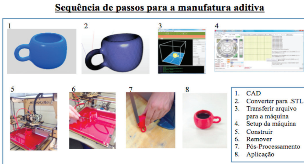
Figura 2 - Etapas para produção de peça por manufatura aditiva.