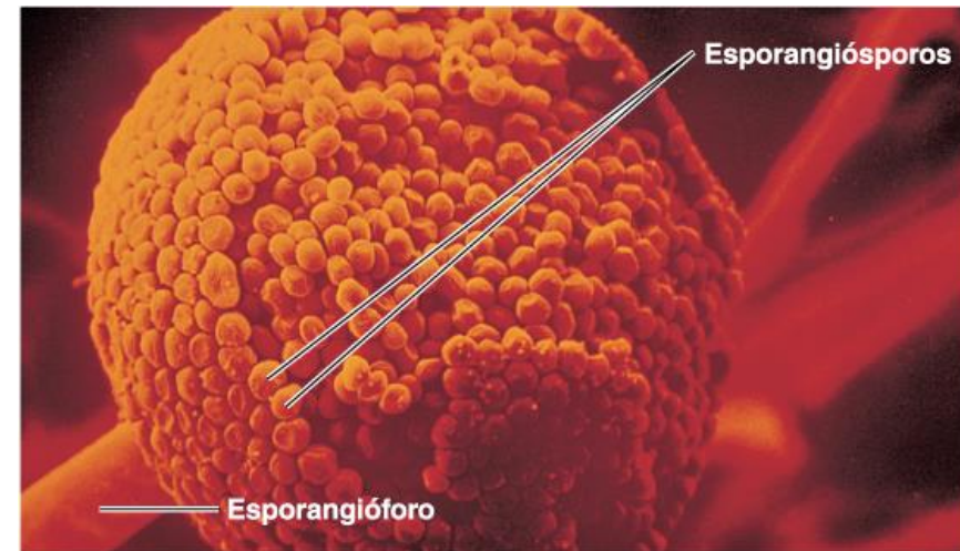
(e) Os esporangiósporos são formados dentro do esporângio (bolsa de esporos) em Rhizopus .