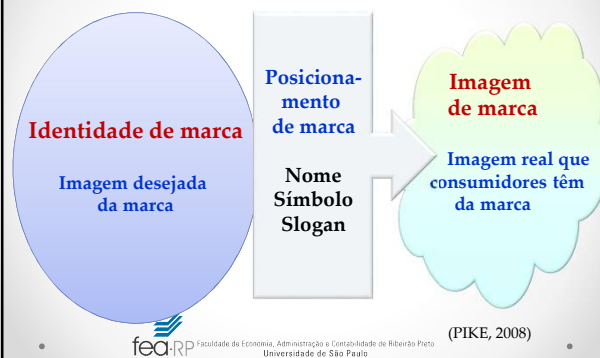
Imagem e identidade de marca