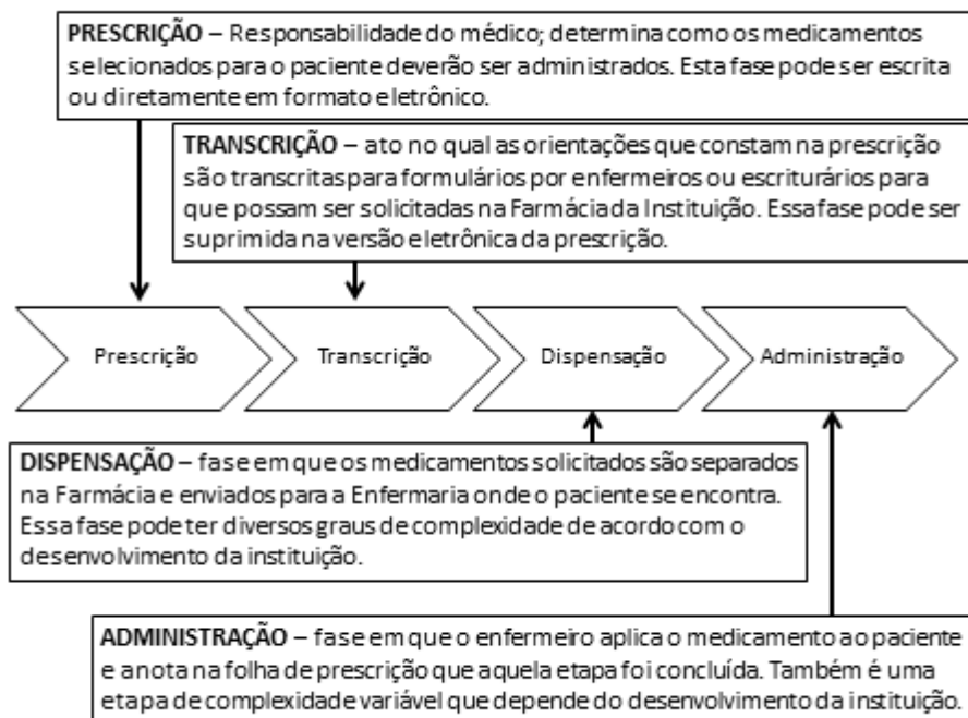
Figura 1: Etapas do processo de fornecimento de medicamentos intra-hospitalar.

A Dispensação é uma atividade técnico-científica desenvolvida na Farmácia. Essa etapa do processo de medicação se inicia com o recebimento da requisição de medicamentos enviada pela unidade assistencial. A Farmácia hospitalar integra as ações desenvolvidas por vários profissionais e setores e sua atuação é de fundamental importância na prevenção e redução de erros. Em uma situação ideal, todas as requisições recebidas pela Farmácia deveriam passar pelo crivo do farmacêutico com o objetivo de identificar