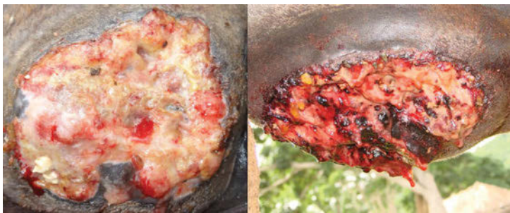
Figura 2. Ulcerações granulomatosas, sobressalentes e elevadas com bordas irregulares e em forma de cratera.

A lesão se caracteriza pela formação de graves ulcerações granulomatosas e granulocíticas sobressalentes com bordas irregulares e em forma de cratera. O tamanho das lesões depende do local e tempo de evolução da infecção e podem ter de 12 a 15 cm ou até 50 cm de diâmetro (Figura 2), com presença de trajetos fistulosos formados pelo Oomiceto em seu processo invasivo no tecido granular (Figura 3). Após a lesão, as células mortas se comportam como corpo estranho, desencadeando uma resposta inflamatória do organismo com a finalidade de promover a sua fagocitose, permitindo o reparo do tecido afetado. Na pitiose o processo da regeneração e cicatrização ocorre na presença de massas necróticas e calcificações que se desprendem facilmente, de coloração branco-amarelada contendo hifas e infiltrado de eosinófilos, cujas dimensões variam de 2 a 10 mm de diâmetro chamado “ kunkers ” (Figura 4) que juntamente com a presença de prurido (Figura 5) e descarga de secreção fibrinosanguinolentas (Figura 6) são inequívocos sinais de pitiose 4,5,6 .