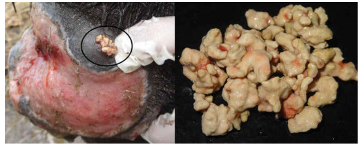
Figura 4. “ Kunkers ”: massas necróticas e calcificações que se desprendem facilmente com coloração branco-amarelada.