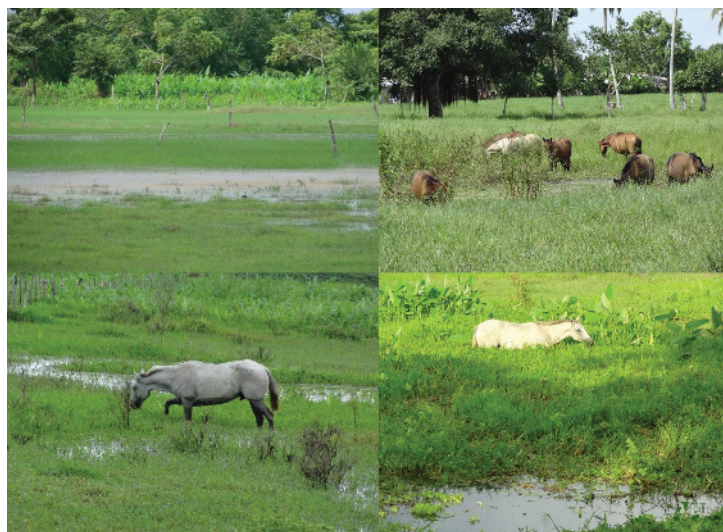
Figura 1. Animais pastando em pastagens alagadas, ambiente ótimo para a reprodução e sobrevivência de P. insidiosum .

A distribuição geográfica é ampla. A pitiose tem sido relatada em vários países tropicais, subtropicais e temperados do mundo, principalmente Brasil, Venezuela, Colômbia, Estados Unidos da América, entre outros 14,31 . As condições ambientais são determinantes para o desenvolvimento do organismo em seu ecossistema. Para haver a produção de zoósporos são necessárias temperaturas entre 30 e 40 °C e o acúmulo de água em banhados e lagoas. A grande maioria dos casos de pitiose tem sido observada durante ou após a estação chuvosa 40 (Figura 1).