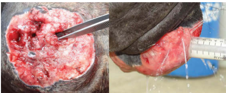
Figura 3. Fístulas formadas pelo oomiceto em seu processo invasivo no tecido granular.