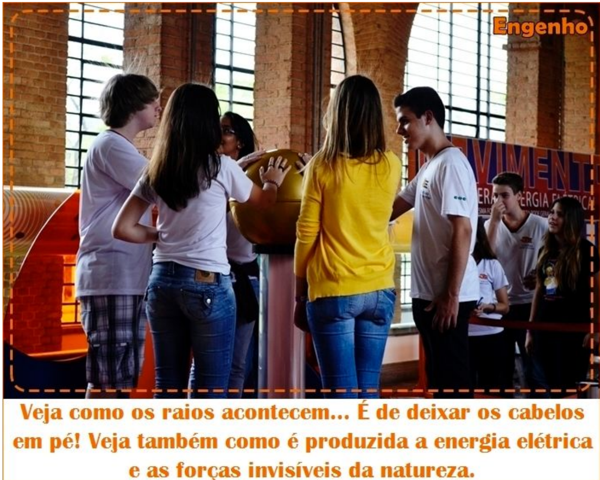
Figura 3: Elétromagnetismo Disponível em < http://www.cataventocultural.org.br/listainst >

A terceira seção, intitulada Engenho, é voltada para as criações humanas através da ciência, é nessa seção que estão as atividades voltadas para a física, experimentos de eletromagnetismo, ótica, mecânica e etc.