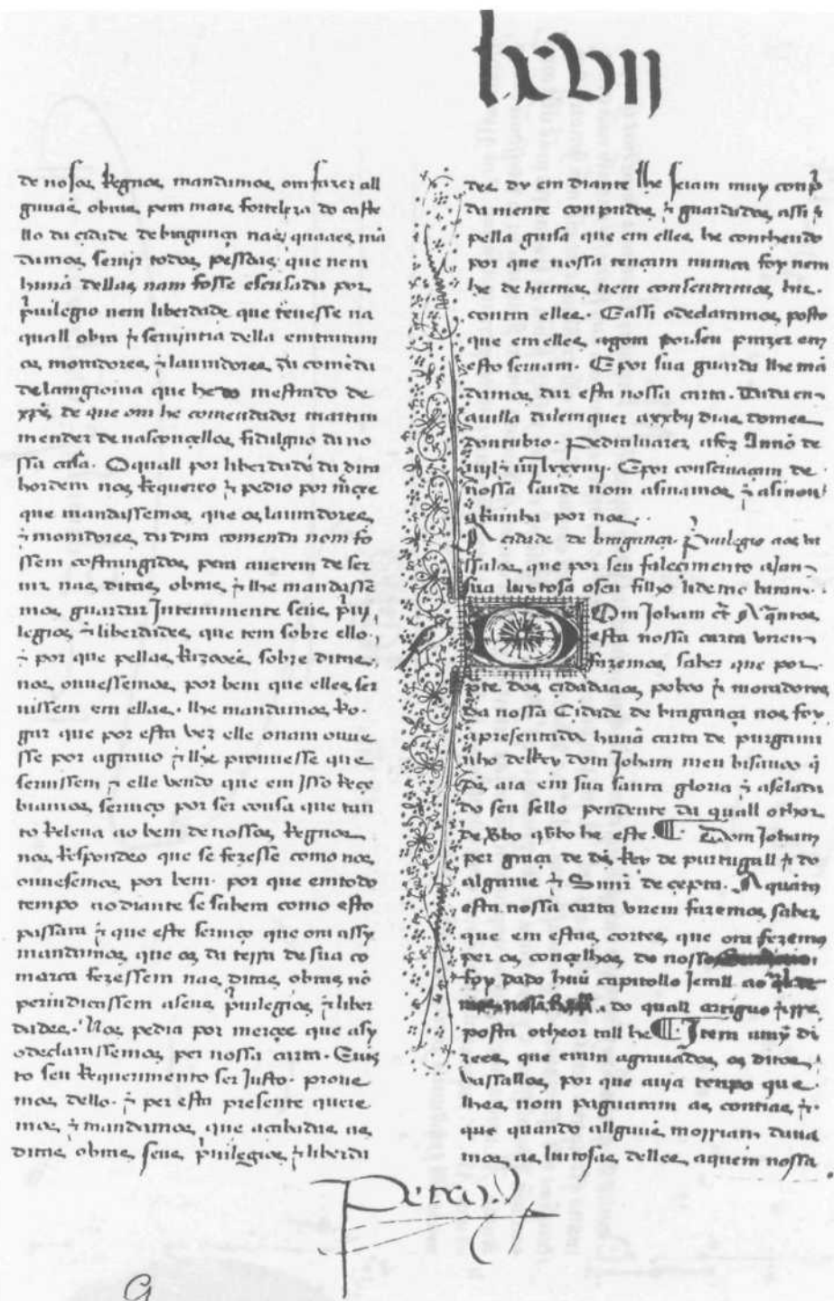
Fig. 9 - A.N.T.T., Leitura Nova. Além Douro, liv. 3, fl. 67.