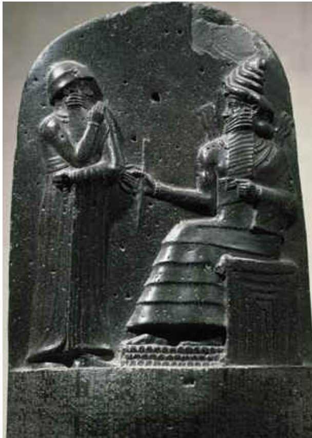
g) Estela da vitória – Naram-Sîn – Akkad (c. 2150 a.C.), detalhe - Museu do Louvre