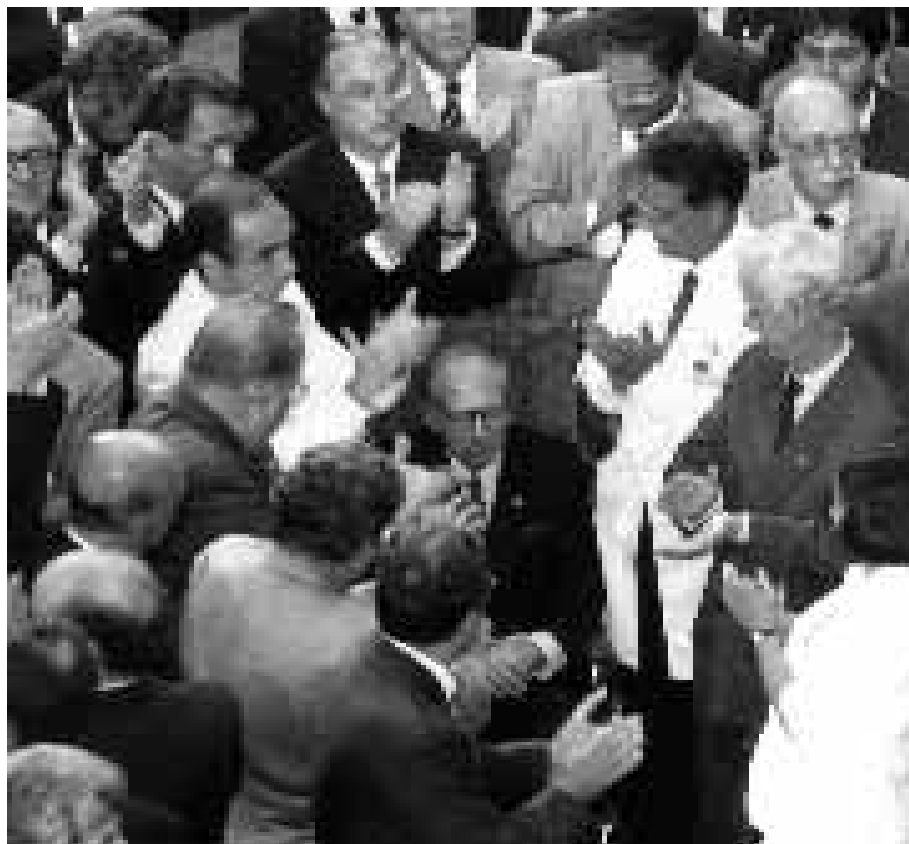
Deputado federal pelo Rio de Janeiro, Roberto Campos — mesmo se recuperando de um problema de saúde (levado de cadeira de rodas) —, foi ovacionado por seus pares ao comparecer ao Congresso Nacional e votar pelo impeachment do presidente Fernando Collor de Mello, em 1990.