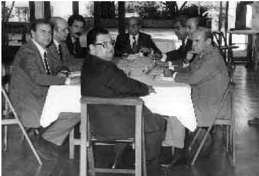
Delfim Netto, César Maia, José Serra, Aloizio Mercadante, Roberto Campos, João Mellão e Francisco Dornelles, discutindo o parlamentarismo em 1993.