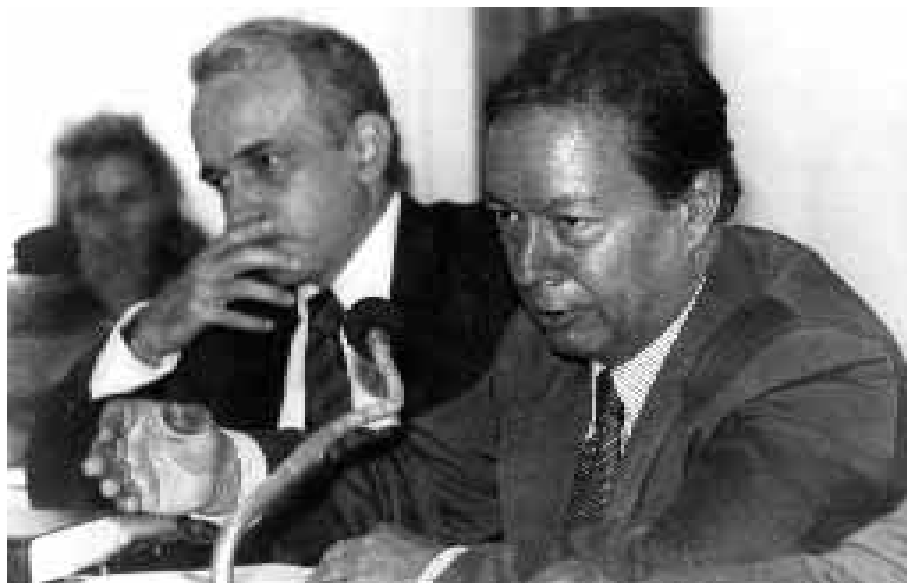
Lara Resende, no cargo de negociador da Dívida Externa, e o então presidente do Banco Central, Pedro Malan, em depoimento na Comissão de Assuntos Econômicos da Câmara dos Deputados, em outubro de 1993.