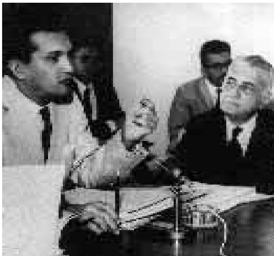
Celso Furtado, em uma reunião da Superintendência do Desenvolvimento do Nordeste (SUDENE) — à sua direita, o sociólogo e escritor Gilberto Freyre.