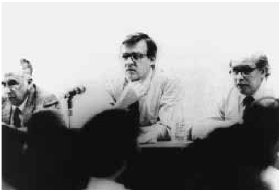
Luiz Carlos Bresser Pereira, Rudiger Dornbusch, economista e professor do MIT, e Mário Henrique Simonsen.