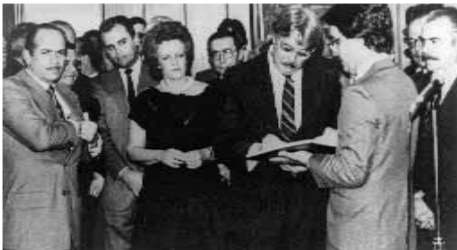
Ernani Galveas, Delfim Netto, João Paulo dos Reis Velloso, Affonso Celso Pastore e José Sarney, na posse de Pastore na presidência do Banco Central, em setembro de 1983.