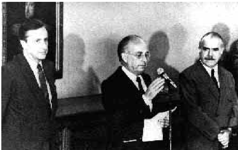
Dilson Funaro, Luiz Carlos Bresser Pereira e o presidente José Sarney, na posse de Bresser no ministério da Fazenda, em abril de 1987.