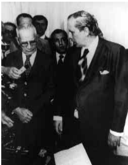
Golberi do Couto e Silva, Heitor de Aquino Ferreira e Mário Henrique Simonsen, em sua despedida do ministério do Planejamento, em agosto de 1979.