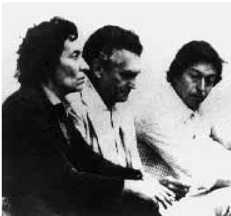
Maria da Conceição Tavares, Celso Furtado e Pedro Malan, na reunião da Sociedade Brasileira para o Progresso da Ciência (SBPC) na UERJ, em 1979.