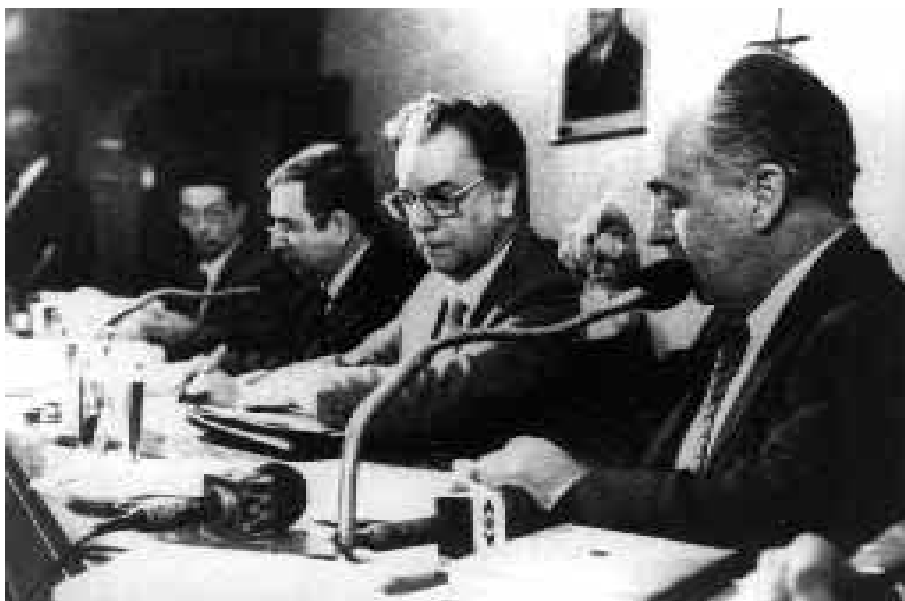
O então senador Itamar Franco e Luiz Carlos Bresser Pereira, em um depoimento no Senado Federal.