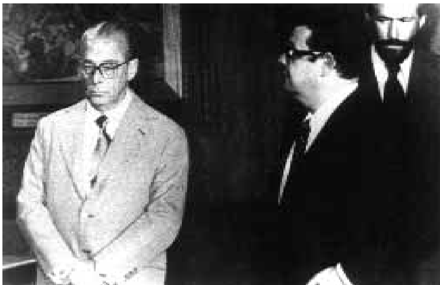
O presidente João Batista Figueiredo, Delfim Netto (sendo empossado no cargo de ministro) e o porta-voz do governo, Alexandre Garcia, em 1979.