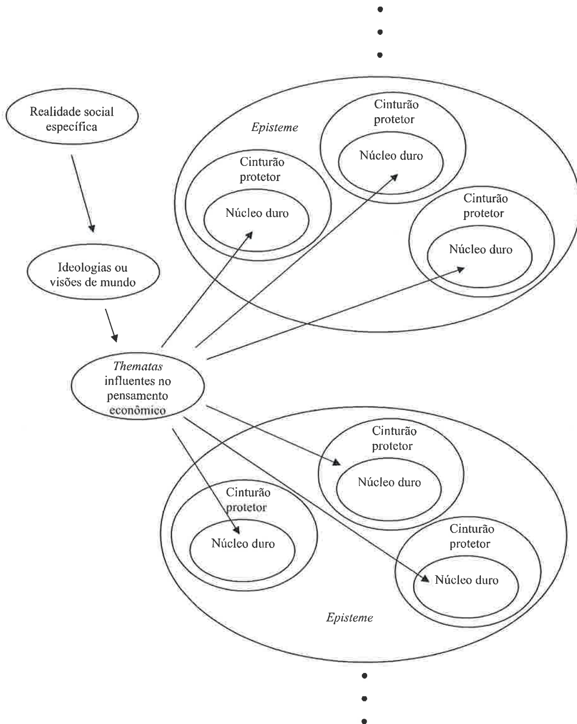
FIGURA 3 Representação Esquemática do Modelo Interpretativo