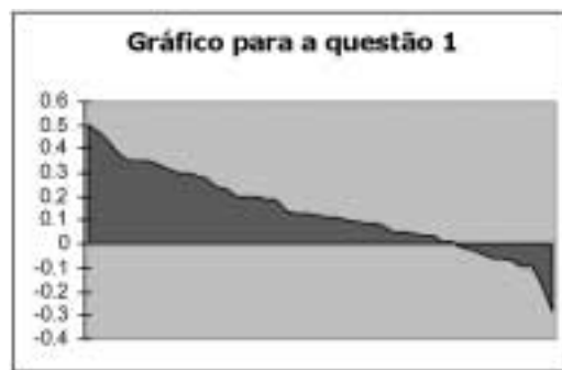
Figura 1: índices atitudinais relativos à primeira questão

Como dissemos, se o índice global de atitude for positivo, a atitude é valiosa, e tanto melhor quanto mais se aproximar do 1. Já, se o índice for negativo, a atitude é ingênua e mais o será quanto se aproximar do -1. O índice geral para essa primeira questão ficou em 0,134, o que nos leva a perceber que, embora longe de ser um índice excelente, é uma pontuação valorosa por ser positiva e, embora em algumas questões (discutidas em separado no final) possamos ver respostas que indiquem uma concepção extremamente ingênua de sustentabilidade, podemos classificar esse resultado como adequado. Podemos observar também que a maior parte dos alunos se concentra na parte positiva da curva, embora nenhum aluno tenha se aproximado da pontuação máxima. É bom destacar que dos 48 alunos que responderam à primeira questão, apenas 10 obtiveram um índice negativo. A figura 1 mostra o índice global para a questão 1, individual, em uma escala que variou entre 1 e -1.