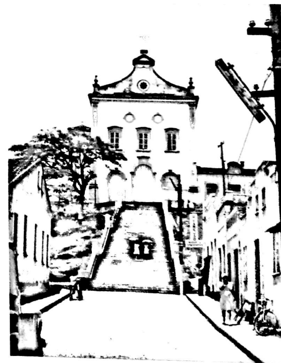
Acima, a casa na cidade de Valença, no Recôncavo Baiano, onde nasceu Zacarias de Góis e Vasconcelos, no dia 5 de novembro de 1815. Ao lado, a igreja do Sagrado Coração, na mesma cidade, onde ele foi batizado.