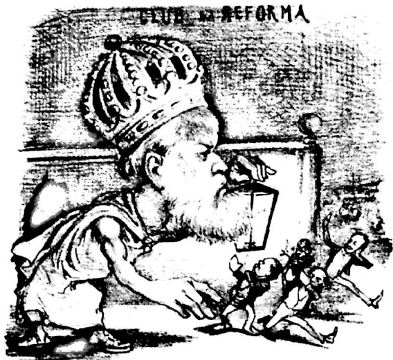
a procura do Conselho de Estado

Ao lado, Zacarias de Góis e Vasconcelos é caricaturado como um dos políticos procurados por d. Pedro II para o Conselho de Estado. Abaixo, à esquerda, cochicha ao ouvido de um colega. Abaixo, à direita, é retratado como religioso numa "Procissão Burlesca".