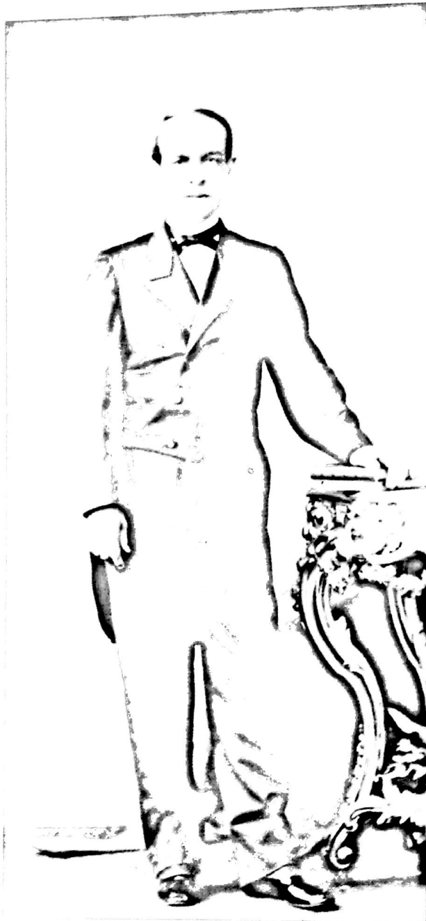
O conselheiro Zacarias era, segundo Joaquim Nabuco, o senador que vigiava todos os outros em dois quesitos: a moralidade e a vestimenta. Sempre vestiu austeras casacas pretas — e tinha o hábito de advertir seus colegas sempre que considerava inapropriados seus trajés.

magistral do partido que no Império mais versou e propagou o idealismo das novas gerações”, situou-o no mesmo patamar de autoridade pessoal ocupado por Bernardo Pereira de Vasconcelos, Eusébio de Queirós, Saraiva e Cotegipe. Defendendo a “tese liberal” contra o “austero e soberano poder”, discutindo as formas de restringir e circunscrever seu exercício, individualizando-se frente aos “liberais românticos”, Zacarias teria conciliado contradições: propôs idéias ousadas, combateu a reação, mas foi avesso aos radicalismos e buscou o caminho da moderação, cultivando um catolicismo ortodoxo. De 1861 até 1868, converteu-se na principal personagem da cena política, quando então “tombou” por suas divergências com o imperador. “Vítima da conjuntura, enrolou-se estoicamente (com o sacrifício do partido, porém inabalável na altivez) na sua bandeira. Com ela desceu ao ostracismo [...] Era o seu modo de ser autoritário, a rija feição do seu caráter, a intolerância natural com a astúcia e a manobra. Ele, com o seu programa, ou mais ninguém!” 30