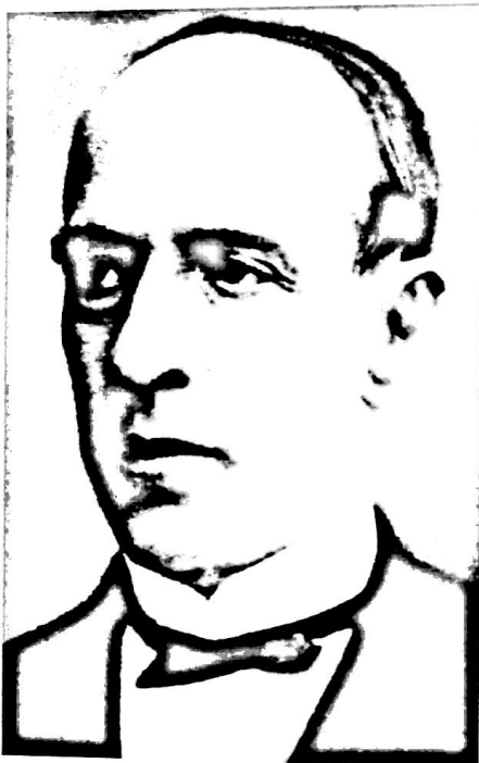
Acima, casa na Rua dos Felizes (atual Dr. Constante Jardim, em Santa Teresa, Rio de Janeiro) onde Zacarias de Góis e Vasconcelos morou nos últimos anos de sua vida e onde faleceu, em 1877. À esquerda, uma de suas últimas fotografias.

que Zacarias, nesse momento, atrelou sua queda e a do gabinete à escolha imperial “não acertada” de Francisco Salles Torres Homem para uma cadeira no Senado, indicação da qual “não podia tomar a responsabilidade”. 81 O discurso de 26 de junho de 1869, apresentado também no Senado, expressa seu oposicionismo ao gabinete Itaboraá e revela a plasticidade do argumento da responsabilidade ministerial que podia adequar-se a situações diversas. Anteriormente o tema foi utilizado tanto para apoiar um gabinete conservador, como o de Caxias, em 1861, quanto para sustentar diretrizes do gabinete “progressista”, em 1864. 82 Já o texto denominado “A dissolução” foi extraído da obra Questões políticas , editada em 1872. Ali o estadista reavaliou as condições políticas de 1868, alterando a interpretação que inicialmente registrou. A indicação imperial para o Senado é tratada como “fútil pretexto”, pois “estava escrito que a espada vitoriosa nos campos de batalha do Paraguai trouxesse de caminho a elevação de seu partido político no Império”. O outro motivo seria “o expediente engenhoso” utilizado pela Coroa “de fazer as reformas liberais coadas pelo filtro conservador”. 83