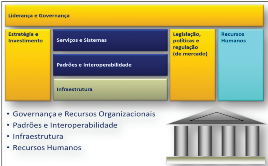
Figura 1 – Os Pilares do e-Saúde

Atividades voltadas para aspectos específicos destes pilares, como a identificação de iniciativas existentes e lacunas, foram desenvolvidas em grupos – um para cada um dos quatro pilares – que se reuniram de forma presencial ou virtual, usando fóruns eletrônicos e web-conferências. O material desenvolvido nos grupos foi sistematicamente disponibilizado no ambiente de colaboração UniverSUS ( universus.datasus.gov.br ) para uso dos membros das oficinas. Todo o material desenvolvido pelos grupos foi consolidado, apresentado a todos os participantes a cada oficina para discussão e validação.