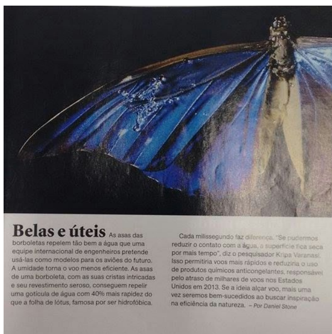
Figura 3: capa e reportagem a ser utilizada na atividade

Depois, os grupos irão expor para toda a classe os resultados de suas discussões, e coletivamente irão identificar que tipo de importância dos animais há em comum entre os textos/tirinhas entregues. Aqui é esperado que os alunos percebam que em todos os textos/tirinhas, e inclusive no vídeo da rádula, a importância dos animais é discutida em torno da utilidade que eles tem para o ser humano.