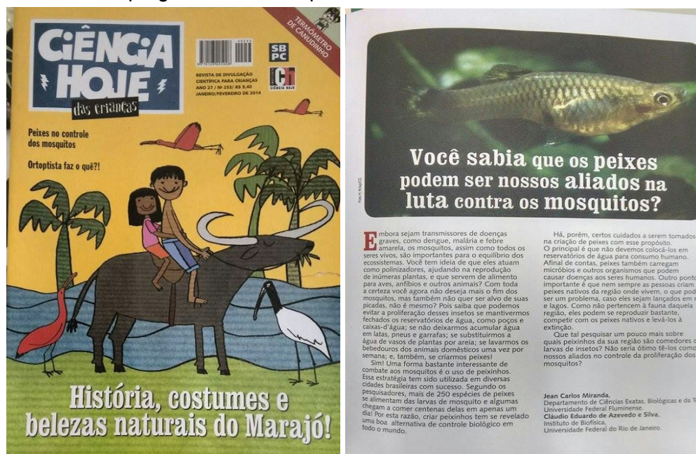
Figura 1: Capa e matéria que será utilizada na atividade

Após a discussão inicial, cada grupo receberá um artigo/tirinha para lerem e discutirem novamente a pergunta “Qual a importância dos animais?”