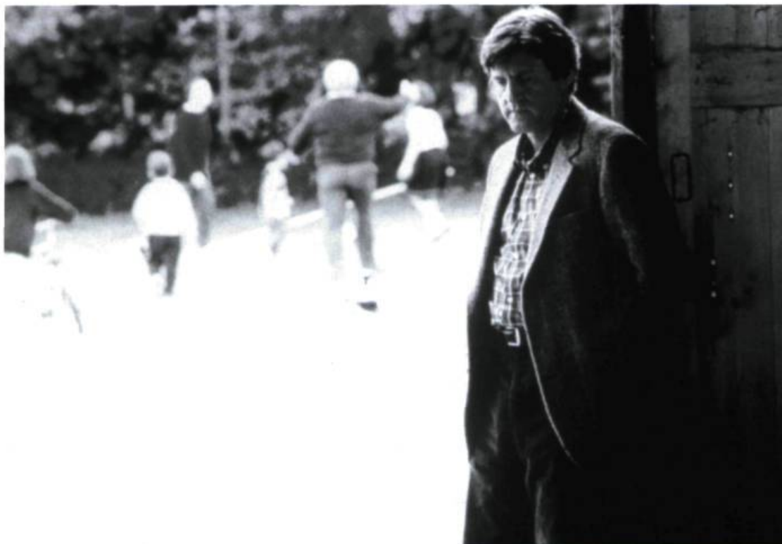
Daniel Auteuil dans L'Adversaire