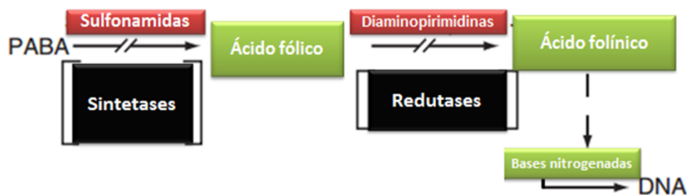
Figura 3 – Representação esquemática do mecanismo de ação das sulfonamidas e diaminopirimidinas.