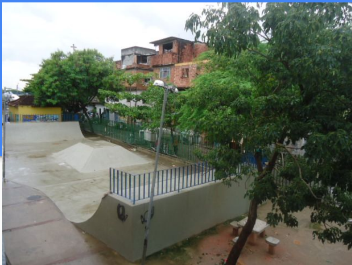
Praça do Valão