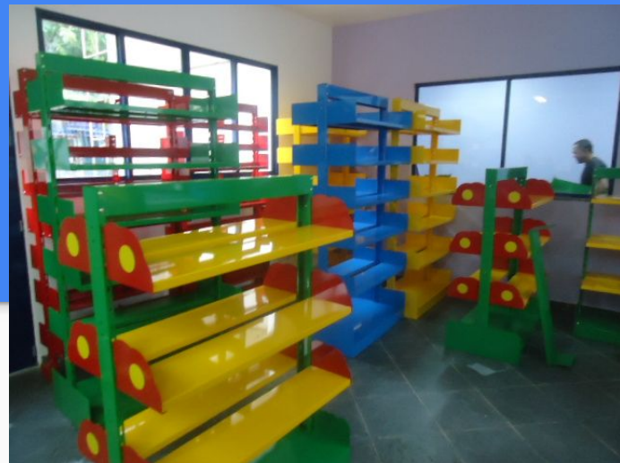
Biblioteca Infantil Lima Barreto