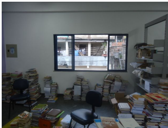
Biblioteca adulto Lima Barreto