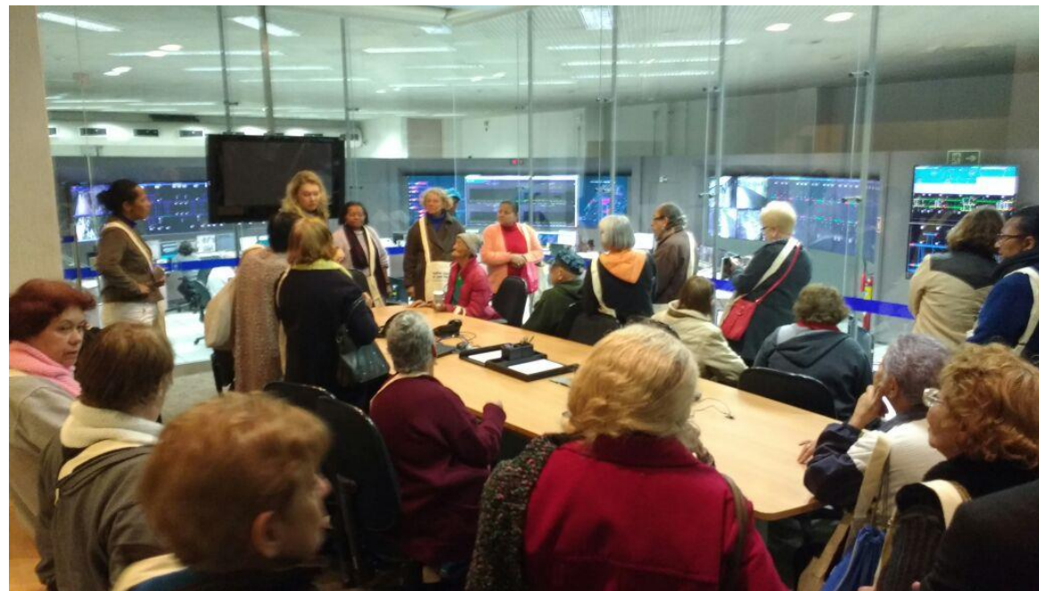
Visita à central de operações do Metrô de SP. Junho/2016.