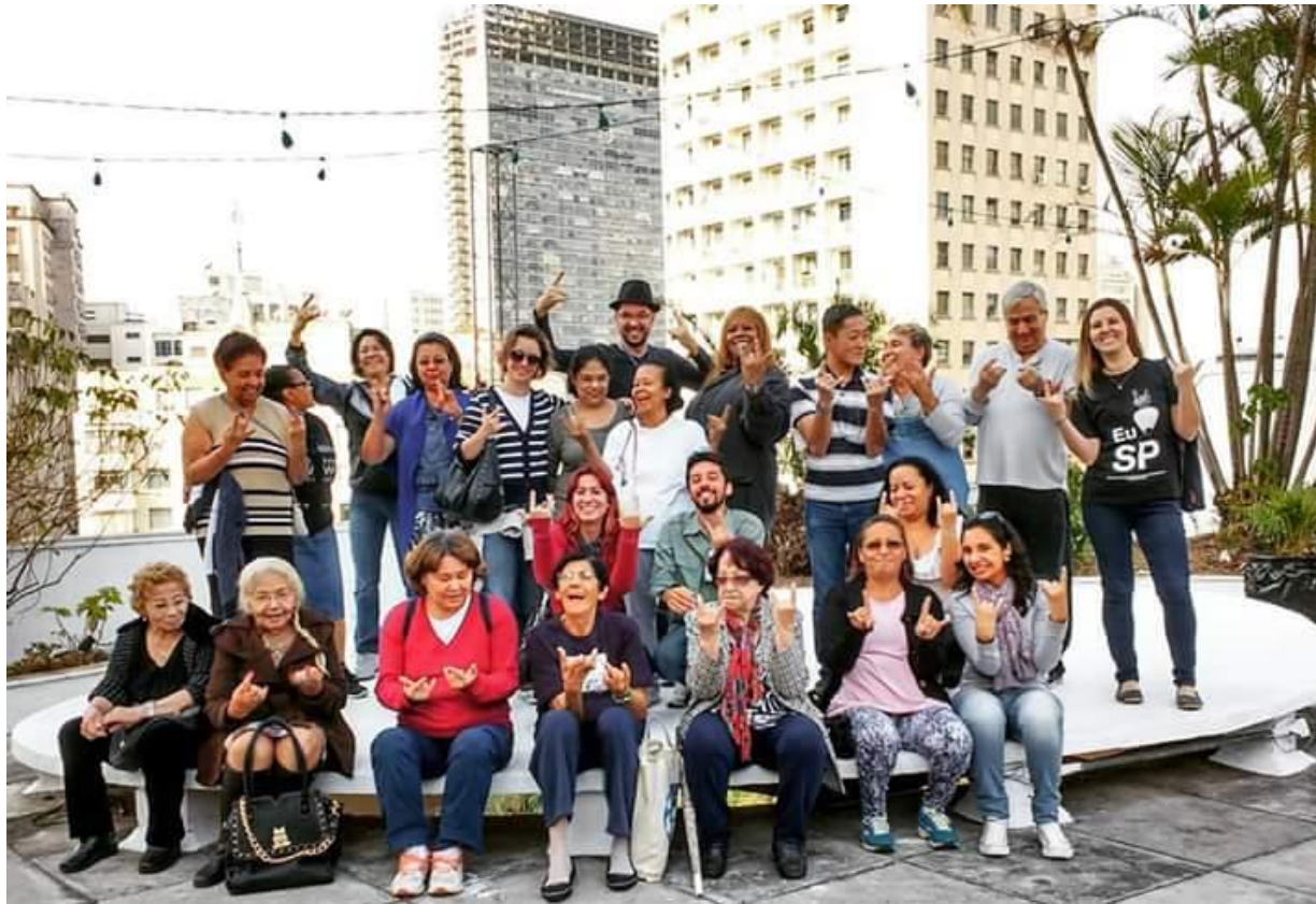
Visita a Galeria do Rock, maio/2016.