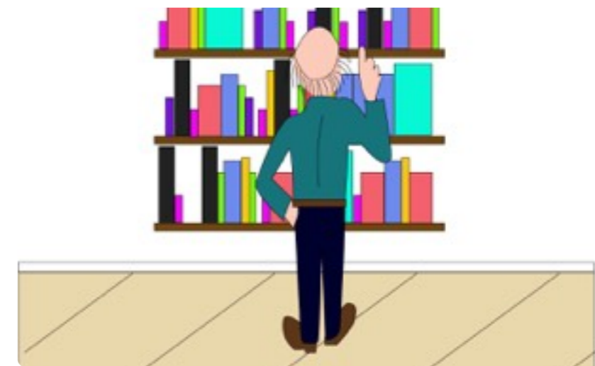
Imagem 1.4 Escolhas

Nesse texto pretendemos discutir sobre seleção de conteúdos de ensino.