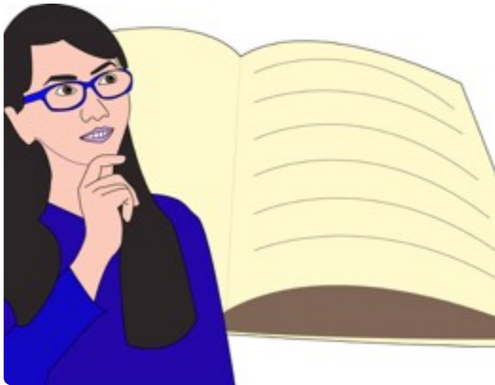
Imagem 1.1 O que é alimentação saudável?

Objetivos e conteúdos procedimentais – procedimentos, técnicas e métodos;