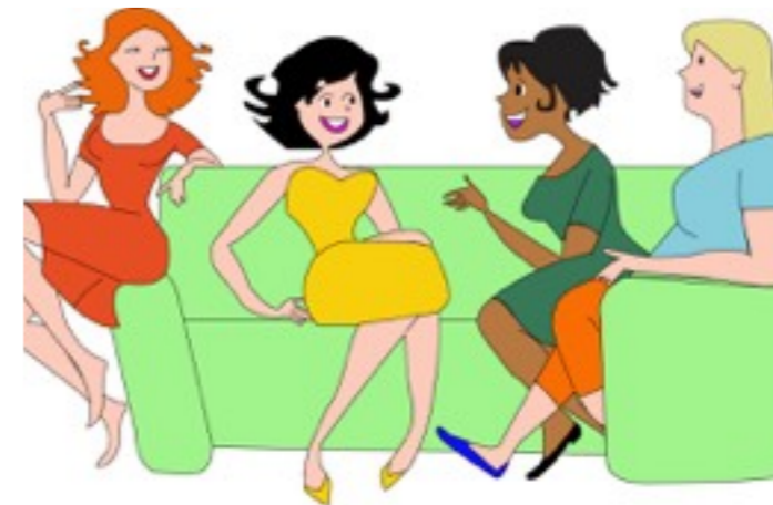
Imagem 1.3 Pessoas conversando