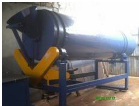
Imagem 1.2. Máquina misturadora - Silo

Os produtos são preparados eletronicamente em um equipamento chamado silo, garantindo uma mistura homogênea e a formulação técnica de cada produto. O processo de preparo leva cerca de uma hora entre mistura e ensacamento, gerando três toneladas de argamassa.