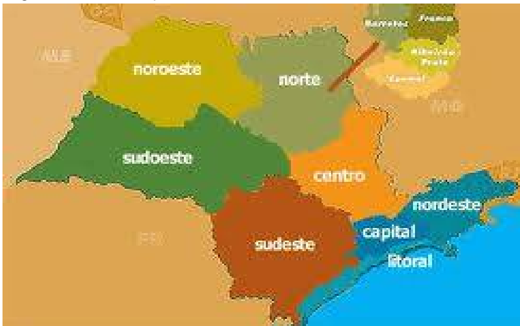
Imagem 1.1 – Área de Atuação

A empresa atualmente trabalha com três linhas de produtos: Argamassa Interna, Argamassa Externa e Argamassa para Porcelanato. A argamassa destina-se ao assentamento de pisos e azulejos em ambientes fechados (argamassa interna ou para porcelanato) ou ambientes abertos (argamassa externa).