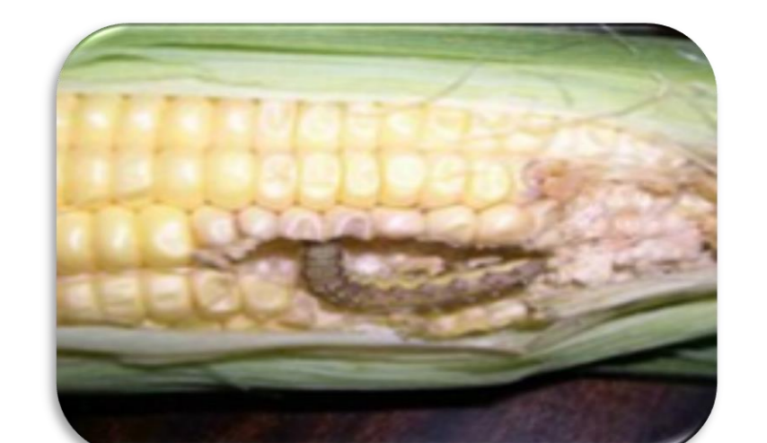
Lagarta-da-espiga ( Helicoverpa zea )