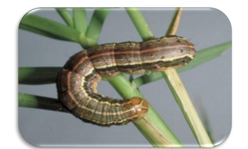
Lagarta-do cartucho ( Spodoptera frugiperda )