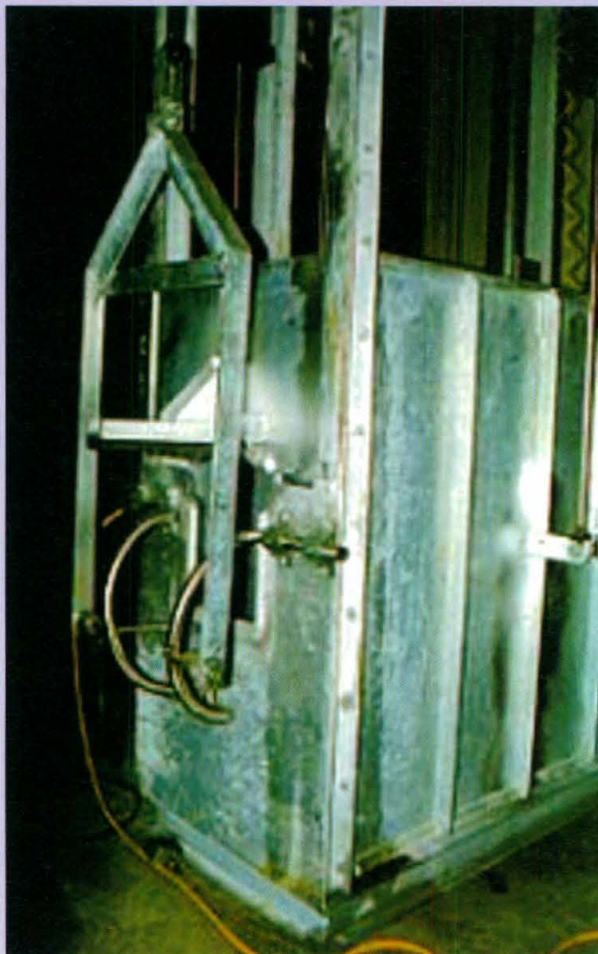
Figura 2. Modelo do boxe de contenção ASPCA.

corta, entre o primeiro e o segundo anel da traquéia, a pele, as veias jugulares, as artérias carótidas, o esôfago e a traquéia, não podendo encostar o fio da faca nas vértebras cervicais. A incisão deve ser executada sem interrupção, sem movimentos bruscos, sem perfuração, sem dilacerações e nem sobre a laringe. Após a incisão, o animal é suspenso ao trilho, seguindo para o término da sangria e esfola (PICCHI e AJZENTAL, 1993; PICCHI, 1996).