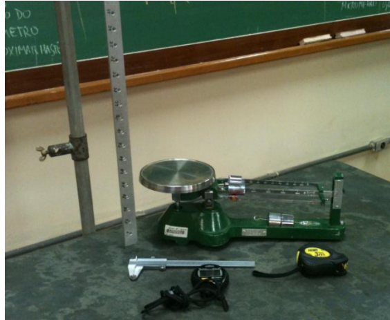
Figura 2. Materiais a serem utilizados no experimento.

Haste de suspensão, uma barra de metal com vários furos que será utilizada como pêndulo físico, cronômetro, trena e balança.