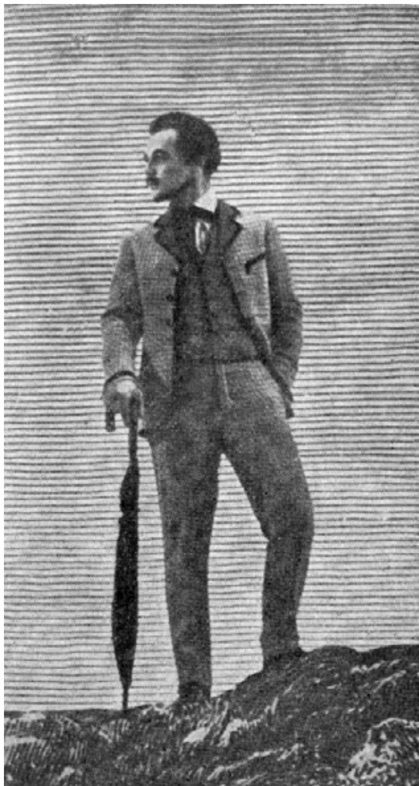
El hombre de Verne

maravillosos álbumes de Ernst) forman, por un extraño golpe de dados, el espejo [13]