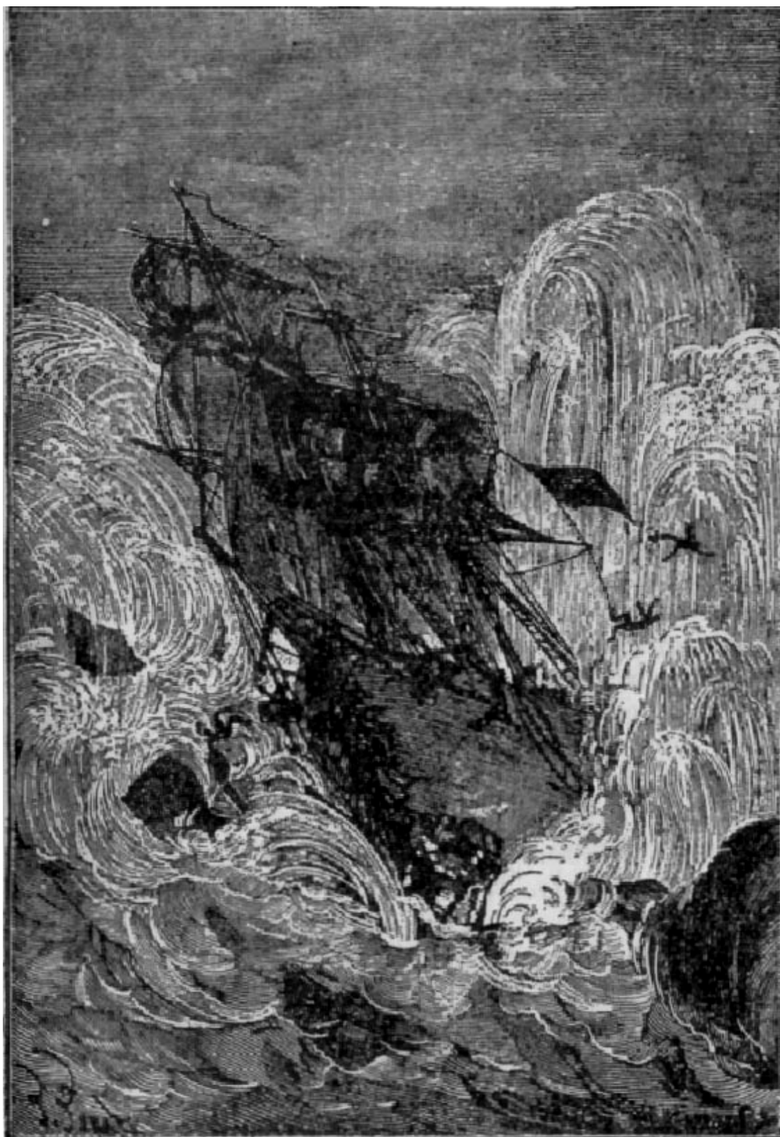
“El bergantín, levantado por una especie de tromba líquida...” (página 84).