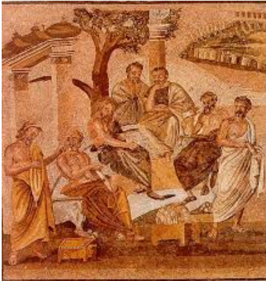
La Mosaique des philosophes de Torre Annunziata, 1er siècle avant J.-C.