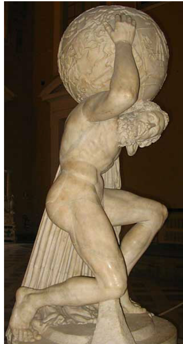
Atlas Farnèse, Rome, Copie romaine du IIe siècle après J.-C.