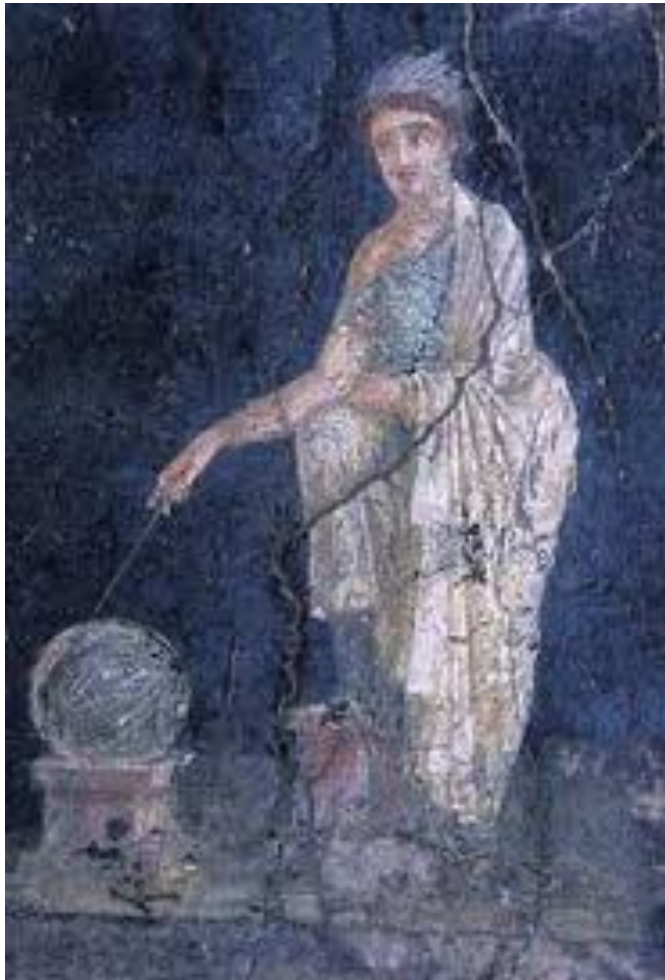
Urania, Pompéi Ve siècle av. J.-C.