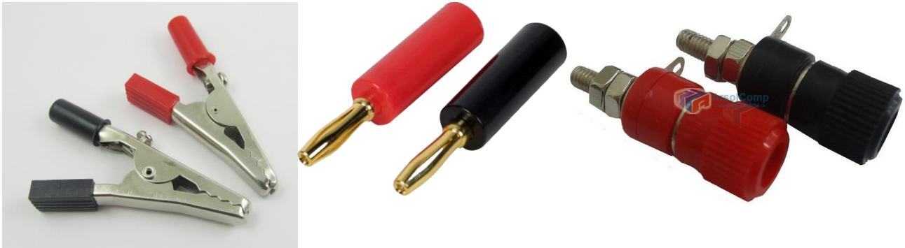
Figura 2 - Exemplos de garras jacaré, pinos bananas e borners.