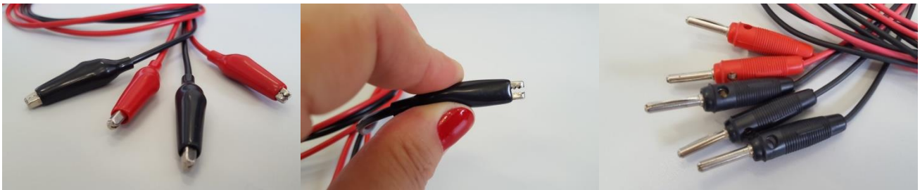
Conectores do tipo jacaré