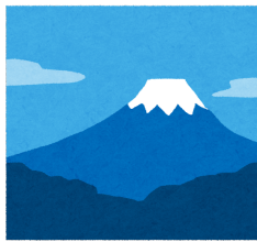
富士山 ふじさん 3376メートル