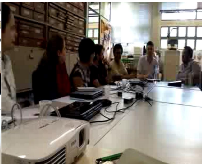
Figura 2. Momento antes da ocorrência do evento.