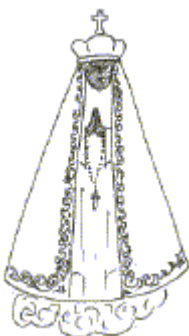
Imagem de N. S. da Aparecida, tatuada no peito ou nas costas em tamanho pequeno, significa símbolo de proteção e esperança dos presos. Tatuada em tamanho grande, acima da metade e

A caravela tatuada, normalmente no coração, significa LIBERDADE