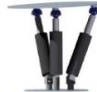
Figura 1: Desenho em CAD da proposta da estrutura

A configuração inicial do robô foi obtida através da comparação entre os conceitos de estrutura paralela e serial. O projeto foi dividido em etapas: Determinação dos graus de liberdade do robô paralelo, determinação dos tipos de juntas, desenho em CAD da configuração inicial (Figura 1), aproximações relativas aos momentos de inércia da estrutura, modelagem da estrutura, simulação de diversas oscilações externas e avaliação da resposta.